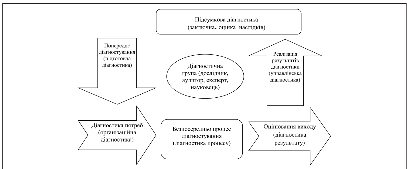
Рисунок 1. Формалізовані етапи проведення діагностики

Для вирішення поставлених діагностикою задач, на нашу думку, необхідно провести певні заходи, що полягають у побудові гіпотез (припущень) з урахуванням вже дослідженого блоку інформації (як правило, фінансової звітності, реєстрів бухгалтерського обліку, первинних документів, цивільно-правових угод, розпоряджень адміністрації тощо) відносно наявності факторів, що можуть негативно впливати на діяльність підприємства, а саме: необґрунтованість витрат та/або їх розміру (витрат на заробітну плату окремим працівникам, здійснення витрат на надання послуг сторонніми суб'єктами господарювання, які підприємство в змозі само виконати – юридичні, послуги з бухгалтерського обліку тощо), неповна завантаженість окремих працівників, не проведення заходів, спрямованих на модернізацію та оновлення виробництва та шляхів здешевлення продукції, що виробляється підприємством, відсутність раціоналізаторських пропозицій працівників підприємства, зайнятих безпосередньо у виробничому