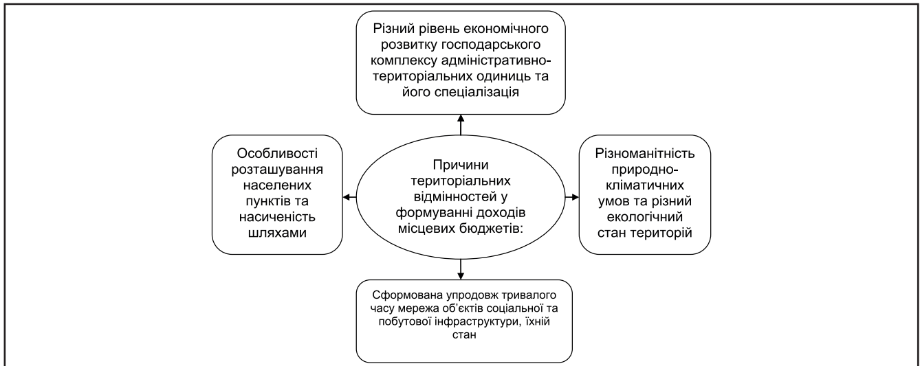
Рисунок 1. Основні причини територіальних відмінностей у формуванні доходів та обсягах видатків місцевих бюджетів

передбачає стимулювання регіонів до фінансової автономії, пошуку додаткових власних ресурсів, активізації внутрішнього потенціалу розвитку, дозволяє балансувати потреби та можливості регіонів. Тому необхідно застосовувати певні заходи щодо усунення проблем, пов'язаних з нерівномірним економічним і соціальним розвитком регіонів країни, зниженням рівня фінансової автономії місцевих бюджетів, невідповідністю видаткових повноважень та відповідних доходних джерел органів місцевого самоврядування.