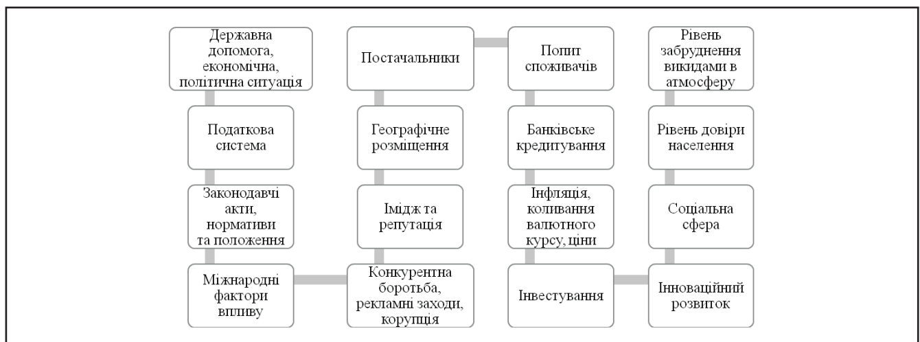
Рисунок 1. Загрози зовнішнього середовища для діяльності підприємств машинобудування

Саме визначення даних факторів створює передумови для покращення інвестиційної, інноваційної, господарської, збутової діяльності, економічної безпеки, налагодження функціонування, але даними загрозами управляти не можливо та їх слід враховувати, уникати та захищати підприємство від можливої ситуації банкрутства.