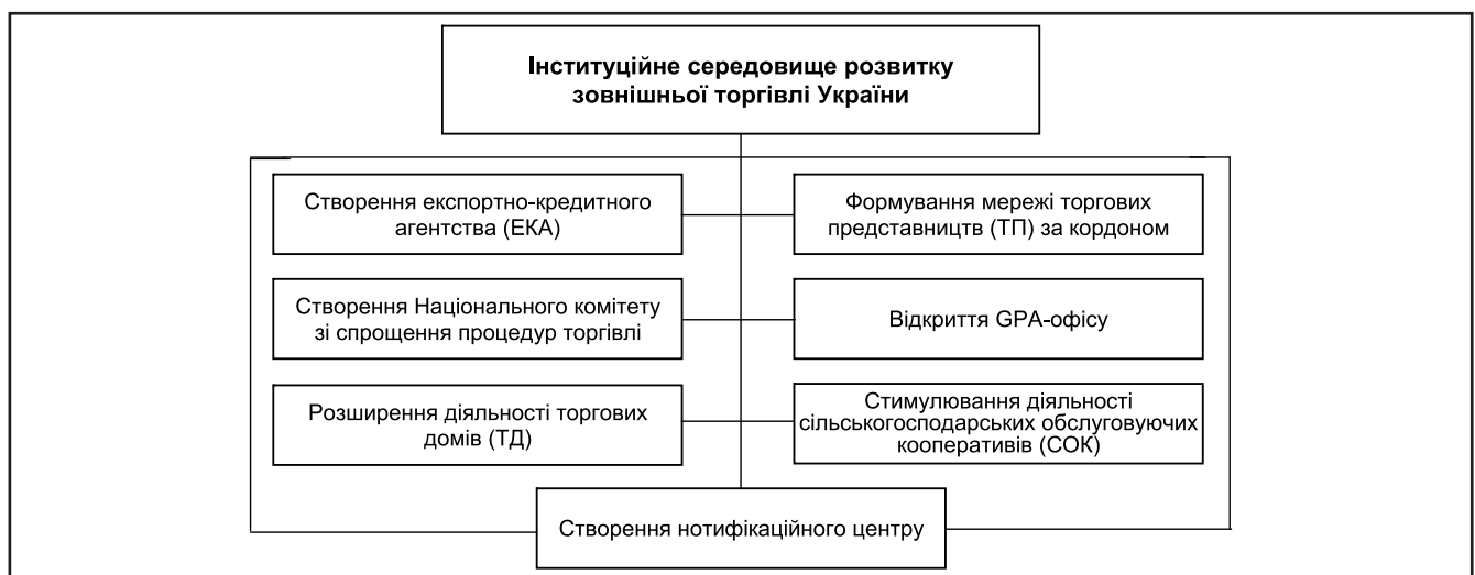
Рисунок 2. Формування інституційного середовища розвитку зовнішньої торгівлі України

Особливо важливим для активізації виходу вітчизняного бізнесу на міжнародні ринки є створення експортно-кредит-