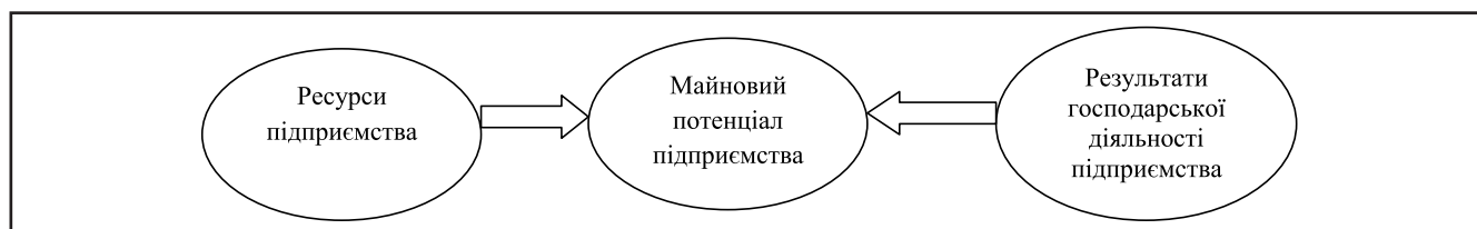
Рисунок 1. Структура майнового потенціалу підприємства

Таким чином, для ефективного формування та використання майнового потенціалу слід враховувати результат управління не тільки необоротними і оборотними активами, але і принципи, методи та підходи, які застосовуються для формування і використання трудового, інноваційного, інформаційного, маркетингового, фінансового потенціалів. Усі вони залежать від впливу чинників зовнішнього середовища. Тому проблема формування та ефективного використання майнового потенціалу суб'єкта господарю-