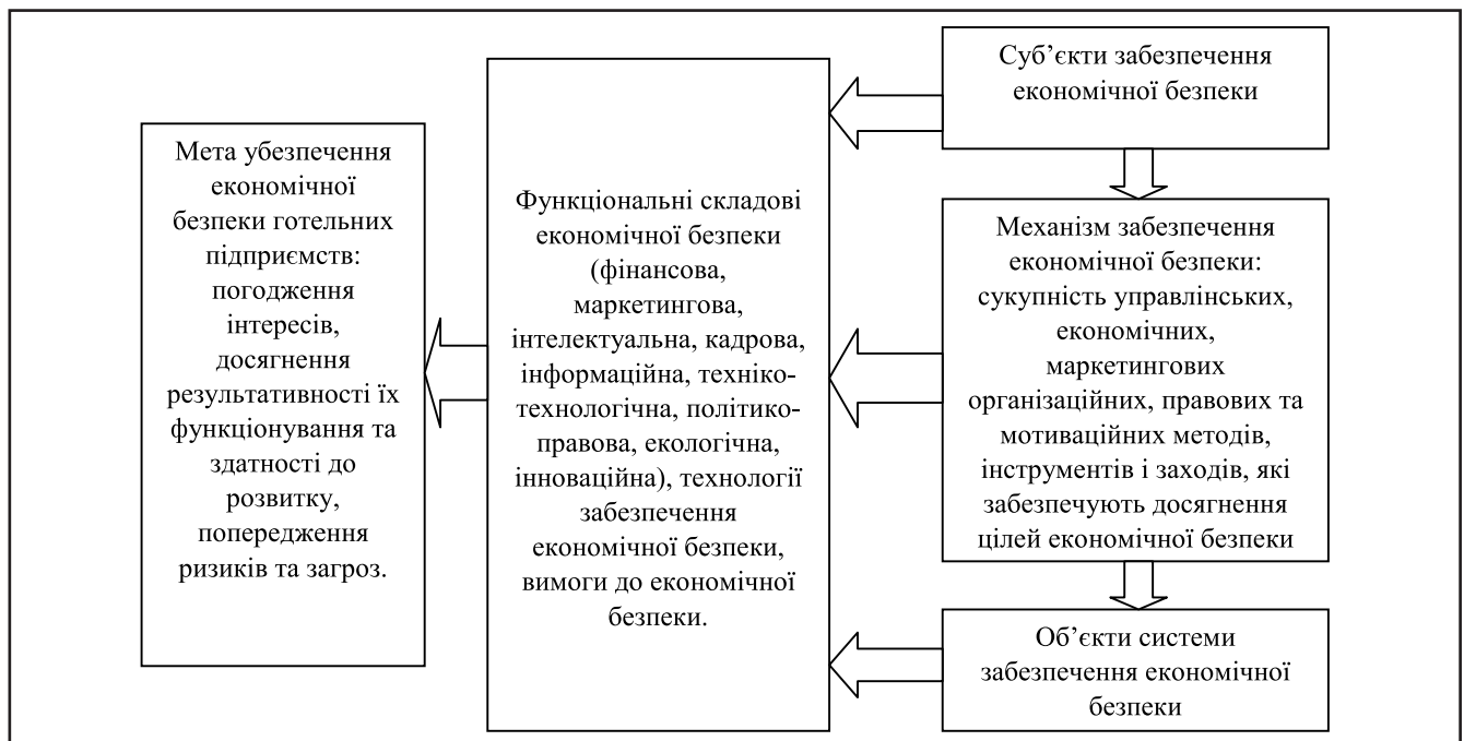
Рисунк 1. Організаційно-економічний механізм формування економічної безпеки суб'єктів готельного бізнесу на основі маркетингових інструментів

Основні організаційно-функціональні задачі, які необхідно вирішувати за допомогою організаційно-економічного механізму системи економічної безпеки на базі маркетингових інструментів зображено на рис 1. Однак, ми вважаємо, що він потребує значної конкретизації із