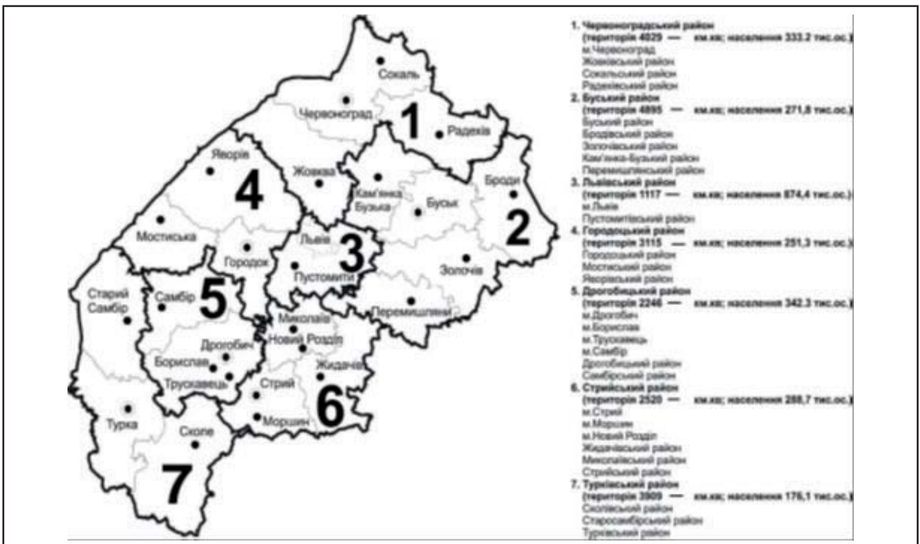
Рисунок 2. Проект укрупнення адміністративних районів Львівської області, запропонований Інститутом регіональних досліджень НАН України [1]

Сучасний адміністративно-територіальний поділ Львівської області. Область (історична дата її утворення 4 грудня 1939 р.) складається з 20-ти сільських районів і 9-ти міст обласного підпорядкування. Всього в області 44 міста, 34 селища міського типу, 1850 сільських населених пунктів (найбільша кількість в Україні). Державну й адміністративну владу забезпечують обласна рада й ОДА, в системі місцевого самоврядування 34 селищних ради, 45 міських рад, 20 районних рад і 632 сільські ради. Слід відзначити, що за період реалізації Схеми планування Львівської області (інститут «Діпромісто», 1974р.) кількість малих міст збільшилася з 71 до 74 одиниць. Протягом 1975–2007 рр. зросла кількість міст з чисельністю населення від 21 до 50 тис. осіб