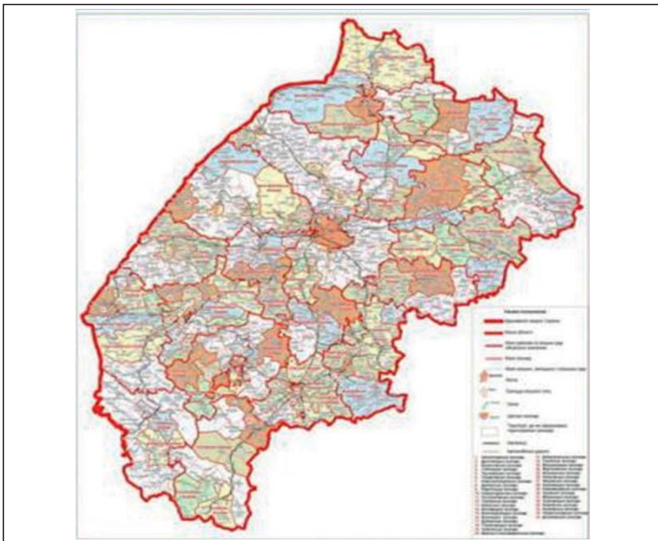
Рисунок 3. План формування громад у Львівській області

2. Вимога людиноцентричності передбачає, що будь-яка підсистема міста спрямована на задоволення потреб життєдіяльності людини. За цим принципом знаходимо закономірності й вимоги, які характеризують відносини людини і простору, в т.ч. пов'язані з діяльністю (виробничою, поведінки, співіснування) людини в середовищі. Діяльність має скеровуватись на покращення якості життя, а території і міські поселення повинні перетворитись у добрі місця для проживання.