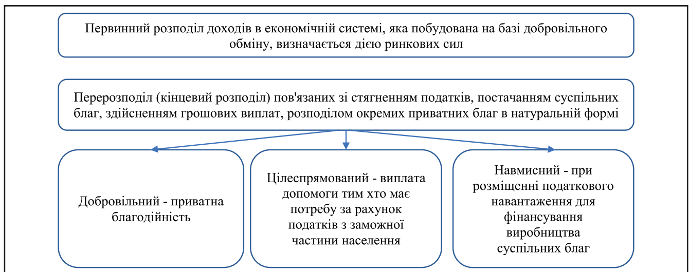
Рисунок 1. Класифікація первинного і кінцевого розподілу доходів

У вітчизняній економічній літературі найчастіше розглядаються окремі концепції теорії добробуту без їх системним викладу і логічної взаємодії та зв'язку. Це обумовлено тим, що дана галузь економічного знання не є монотеорією, а складається з безлічі різнорідних ніх гіпотез, концепцій, теорій: