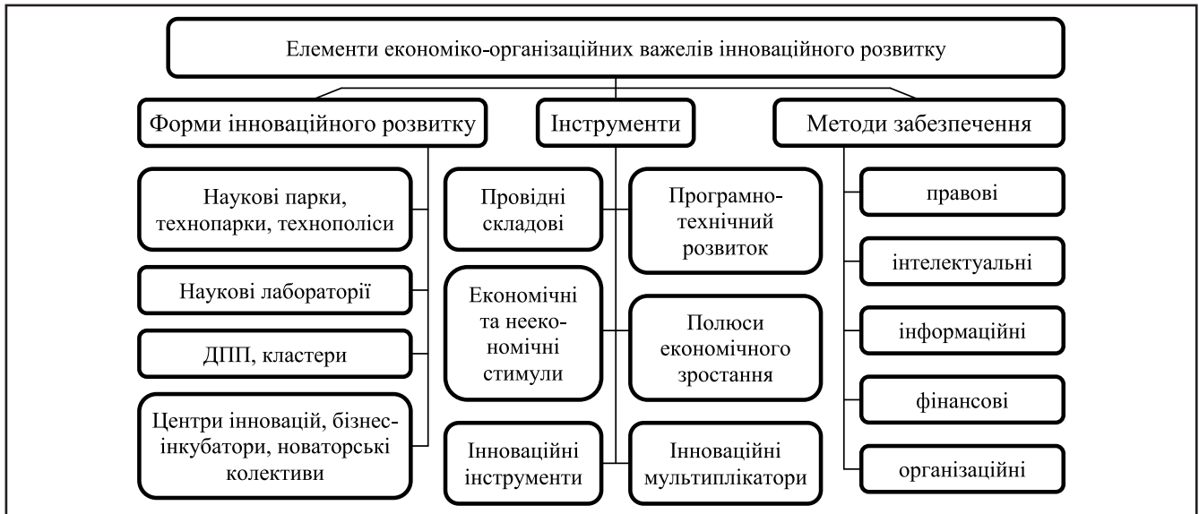
Рисунок 3. Елементи економіко-організаційних важелів інноваційного розвитку