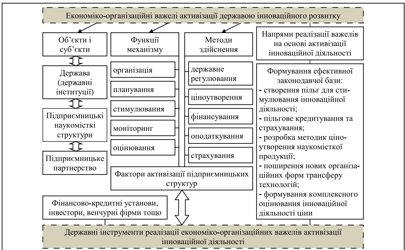
Рисунок 4. Економіко-організаційні важелі активізації державою інноваційного розвитку економіки

Держава як регулятор підприємницької діяльності формулює пріоритети в сфері інноваційного розвитку економіки країни, легалізує інституційне, економічне й організаційне підґрунтя державного регулювання розвитку ринку