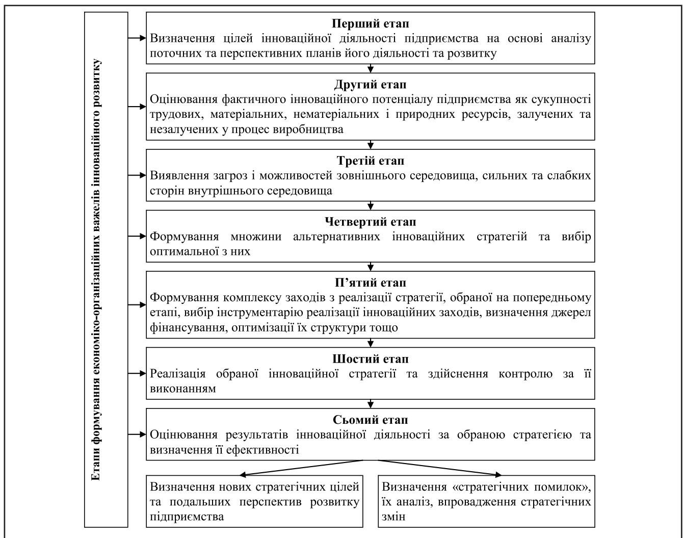
Рисунок 1. Етапи формування економіко-організаційних важелів інноваційного розвитку країни

У загальному вигляді, за структурою економіко-організаційні важелі інноваційного розвитку економіки країни можуть бути представлені як ряд етапів, що у сукупності формують систему функціональних взаємовідносин об'єктів, суб'єктів, засобів, методів та інших складових інноваційної діяльності і можуть використовувати-