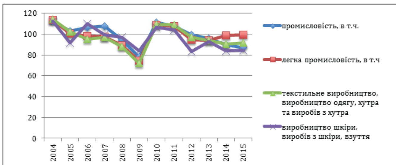
Рисунок 1. Динаміка індексів промислової продукції України за 2004 – 2014 роки (розраховано за даними [2])