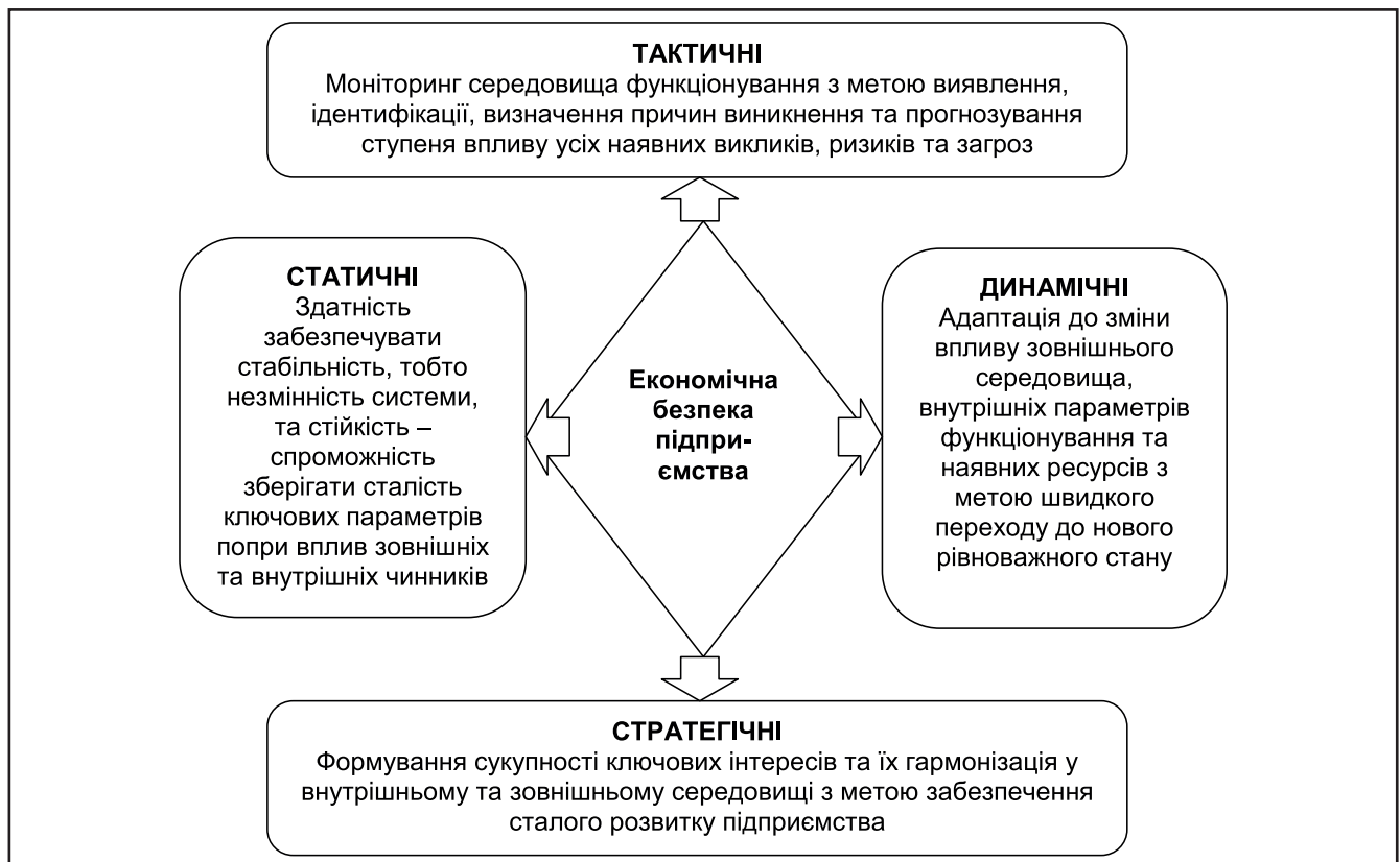
Рисунок 1. Сутнісні параметри поняття «економічна безпека автотранспортного підприємства», розробка автора

Перший підхід визначено на основі опрацювання публікації З. Якубович, в трактуванні якої під системою економічної безпеки підприємства