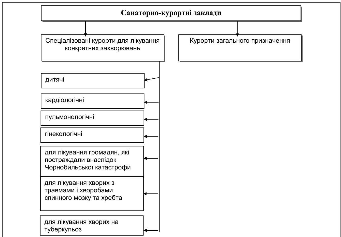
Рисунок 2. Спеціалізація санаторно-курортних закладів України

Зазначені види зумовлюють специфіку процесу лікування, обслуговування населення, використання спеціального обладнання природних ресурсів та необхідність створення додаткових умов для їх проживання. Виокремлені особливості зумовлюють додаткові витрати на створення всіх умов для оздоровлення та відпочинку населення, й отримання доходів від надання основних та додаткових санаторно-курортних послуг, адже поряд із санаторно-курортним закладом, який за-