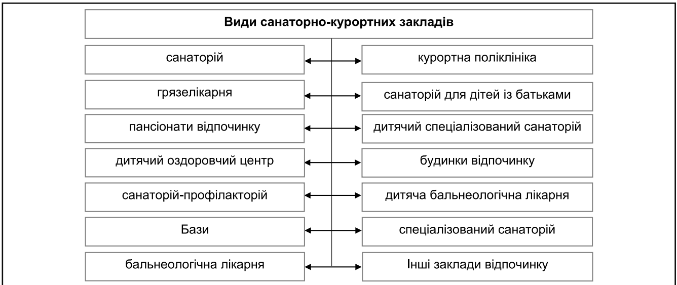
Рисунок 3. Види санаторно-курортних закладів

безпечує надання оздоровчих, лікувальних та профілактичних послуг, підприємства санаторно-курортного комплексу охоплюють ще й обслуговуючі та допоміжні виробництва.