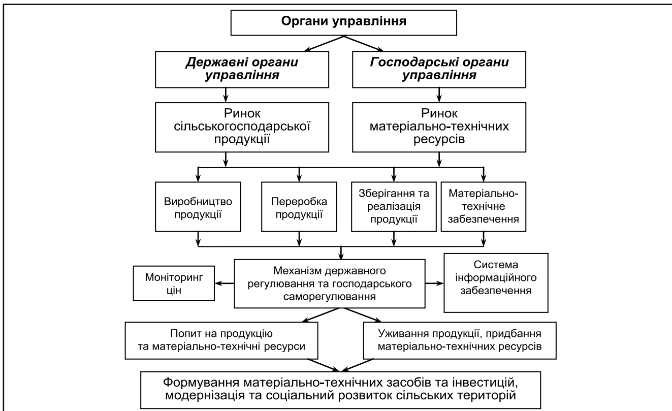
Рисунк 3. Складові елементи системи державного регулювання і саморегулювання ринку сільськогосподарської продукції