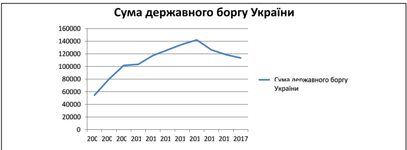
Рисунок 2. Динаміка зміни суми державного боргу України