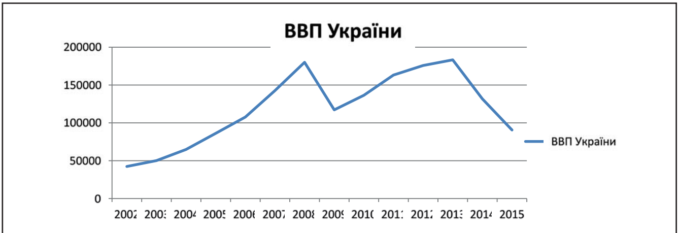
Рисунок 1. Динаміка зміни ВВП України протягом останніх 14 років