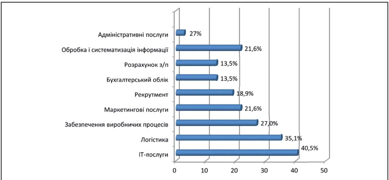
Рисунок 2. Структура аутсорсингових послуг вітчизняних компаній, (%)

Україна є однією з країн, які є найбільш потенційно привабливими для аутсорсингу, та знахо-