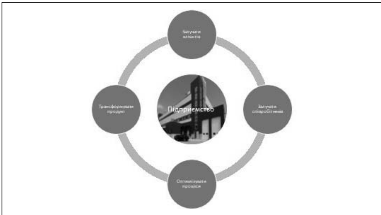
Рисунки 2. Новий підхід до організації бізнесу на основі залучення клієнтів і співробітників в підприємницьку та інноваційну діяльність

роль окремих підприємців та інноваторів – людей, здатних щось винайти або придумати і запустити виробництво, дещо знижується. Жодної конкурентної переваги або ї більш ефективної технології виробництва, боротьба йде за кожну соту відсотка економії і вигоди на всіх стадіях виробничого процесу. У зв'язку з цим, все більше говорять про колективні інновації, тому і завдання керівника часто розглядають – як створення умов для формування таких інновацій та розвитку внутрішньофірмового підприємництва, в кінцевому підсумку для творчості і самореалізації людей, розширюючи їх до клієнтів компанії, які також можуть брати участь в процесах оптимізації.