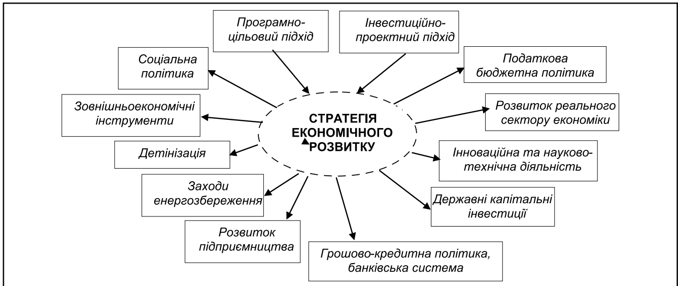
Рисунок 1. Зміст базових елементів стратегії розвитку