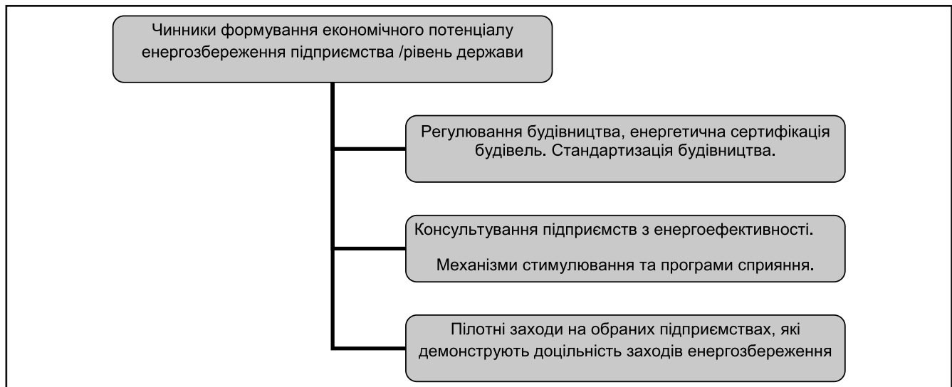
Рисунок 3. Концептуальна модель систематизації чинників формування економічного потенціалу енергозбереження будівельного підприємства/ рівень держави.