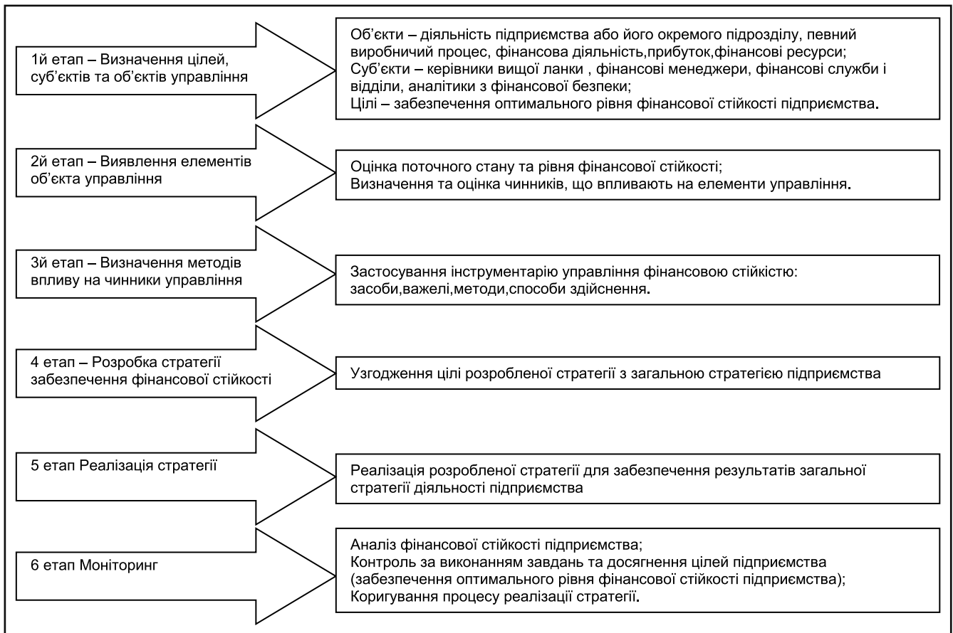
Рисунок 2. Етапи розробки механізму управління фінансовою стійкістю підприємства [сформовано авторами на основі джерел 7,13]

талу. На зменшення наявності власних оборотних коштів підприємств вплинуло зниження суми оборотних активів швидшими темпами, ніж зменшення поточних зобов'язань підприємства. Такий стан є негативним для діяльності підприємств та сприяє зниженню їхньої фінансової стійкості.