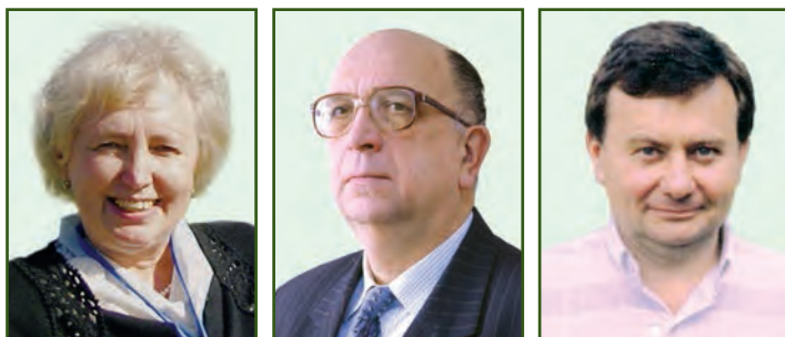
ШЕВЦОВА З.І. 1 , ГАПОНОВ В.В. 2 , ЧАБАН Н. 3

1 ГУ «Інститут гастроентерології НАМН України», г. Днепр, Україна