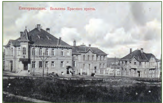
Екатеринослав. Больница Красного Креста