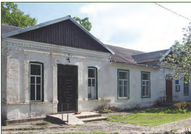
Село Семеновка. Больница