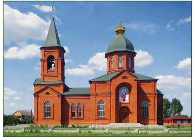
Місто Перещепине. Свято-Преображенський храм. 2016 рік