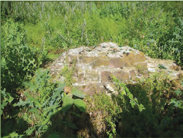
Село Личкове. Тут колись була церква. 2016 рік