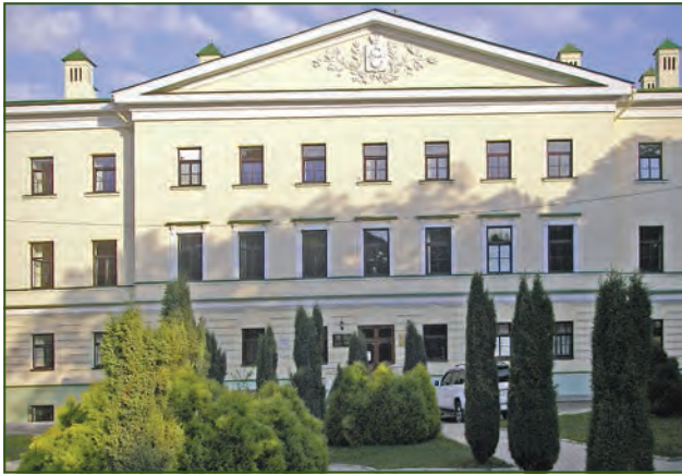
Місто Дніпро. Обласна клінічна лікарня імені І.І. Мечникова (колишня губерньська земська). 2015 рік

Як відомо, Ілля Ілліч Мечников залишив Росію в 1887 році після запрошення відомого вченого Луї Пастера працювати у створеному ним інституті в Парижі. Останні сорок років свого життя Ілля Мечников прожив у Франції, на батьківщині бував наїздами. У 1911 році він очолив експедицію Інституту Пастера під час епідемії чуми в Росії, намагався розробити засоби захисту від чуми та туберкульозу.