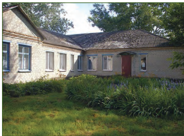
Личківська амбулаторія загальної практики — сімейного лікаря. 2016 рік