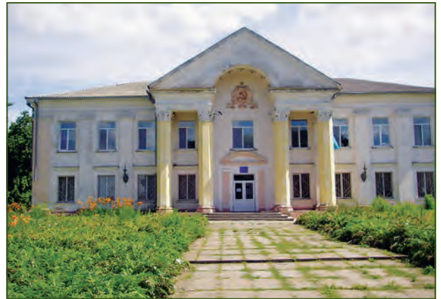
Перещепинська амбулаторія загальної практики — сімейного лікаря. 2016 рік