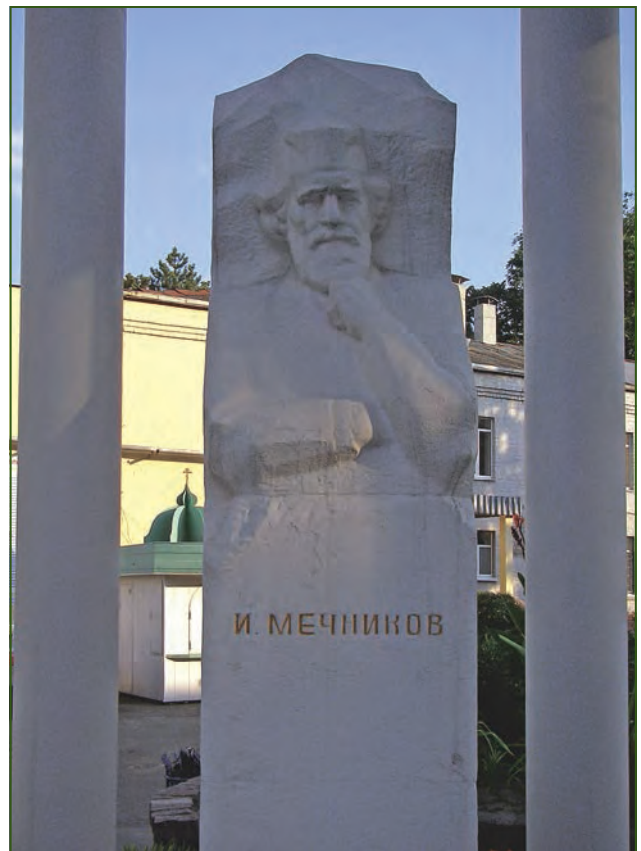
Місто Дніпро. Пам'ятник І.І. Мечникову на території обласної лікарні. 2015 рік

Місто Перещепине і село Личкове нині мало нагадують давніші часи. Споруди, збудовані Наталією Черкаською, на жаль, не збереглися. У Перещепині є кілька будівель земського походження (професійний ліцей, млин, крамниця, школа). Збудовано Спасо-Преображенський храм. Функціонує Перещепинська амбулаторія загальної практики — сімейного лікаря. У колишній лікарні діє пункт швидкої медичної допомоги й місцева бібліотека.