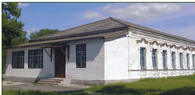
Місто Перещепине. Колишня земська школа. 2016 рік

кімнат: у трьох — палати, в одній — аптека, у сусідній — пацієнти, які приходили по допомогу. У приймальному покої було розміщено сім ліжок. Особистий персонал складався з лікаря, завідуючого покоєм і 2-ю лікувальною дільницею, фельдшера (земського), двох приватних безоплатних фельдшерських учениць і служителя.