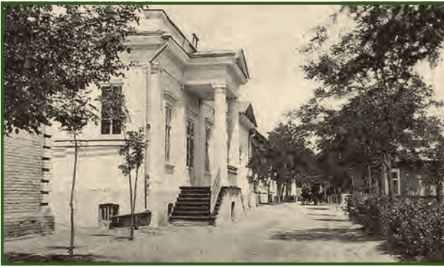
Місто Слов'янськ. Грязелікарня. Поштова листівка початку ХХ століття