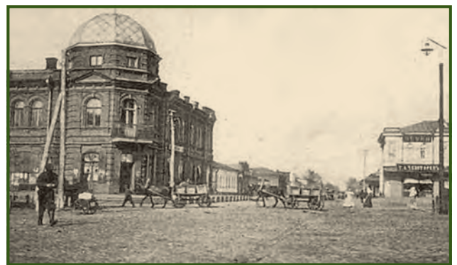
Центральна частина міста Слов'янська. Поштова листівка початку ХХ століття

Подальша професійна діяльність В.Т. Скрильникова тривала в Слов'янську. Виникнення міста пов'язане з видобутком солі на Торських озерах. У другій половині XVII століття в цих місцях була збудована фортеця й засновано місто Тор, якому постійно загрожувало Кримське ханство. Оселялись на цій території переважно втікачі від кріпацької неволі. У 1670 році вони підтримали повстання, очолюване Олексієм Кульгавим (соратником Степана Разіна), у 1707 році поповнили повстанські загони Кіндратія Булавіна. Після закінчення російсько-турецької війни (1768–1774 рр.) Кримське ханство перейшло під покровительство Росії, і фортеця Тор втратила військово-оборонне значення. Історія Слов'янського курорту почалася з 1832 року, коли штабс-лікар Олексій Яковлев із групою солдат Чугуївського госпіталю прибув до Слов'янська. На південному березі озера Ріпного він розгорнув намети для хворих і почав лікувати їх спершу озерною водою, а потім грязями. Результат виявився настільки вражаючим, що наступного року на березі озера побудували приміщення для кип'ятіння води й площадку для намазування хворих грязями. У 1838-му на озері влаштували купальні, з часом відкрили лікарню як відділення Чугуївського військового госпіталю на 200 місць. У 1852 році спорудили бальнеологічний заклад для цивільних осіб. Потужний розвиток курорту розпочався з 1876-го, коли він перейшов у підпорядкування міста й було створено управління Слов'янськими мі-