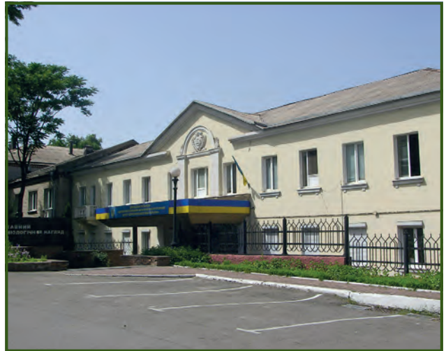
Місто Дніпро. ДУ «Дніпропетровський обласний лабораторний центр Держсанепідслужби України» (у минулому – санітарно-епідеміологічна станція). Фото 2016 року