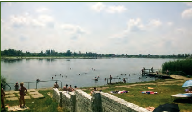
На Слов'янському курорті. Фото 2016 року

травлення призначали мінеральну воду з трьох джерел: Слов'янського, Західно-Слов'янського і Святогірського. У зв'язку з бойовими діями на Сході України значно постраждала інфраструктура Слов'янського курорту. Нині проводяться відновлювальні роботи із забезпечення міста й навколишніх селищ водо-, газо- та електропостачанням. З 20 жовтня 2014 року поновлена робота спінального відділення санаторію «Слов'янський», з лютого 2015 року відкрився один поверх ортопедичного відділення.