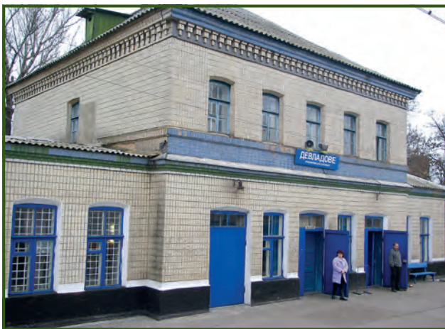
Залізнична станція «Девладове». Фото 2009 року