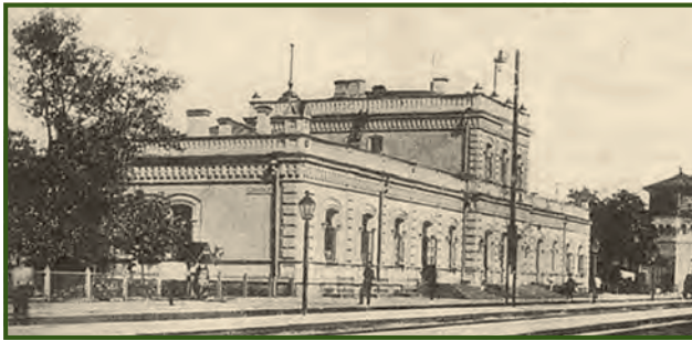
Місто Слов'янськ. Вокзал. Поштова листівка початку ХХ століття

уранових руд. У липні 1965 року отримано перший уран на ділянці підземного вилуговування «Девладове», а через вісімнадцять років, у 1983-му, родовище було вже повністю відпрацьоване. Нині до складу Девладівської сільради входять шість населених пунктів. Ось така доля місцевості, де було знайдено родовище глини, лікувальні властивості якої вивчав лікар В.Т. Скрильников.