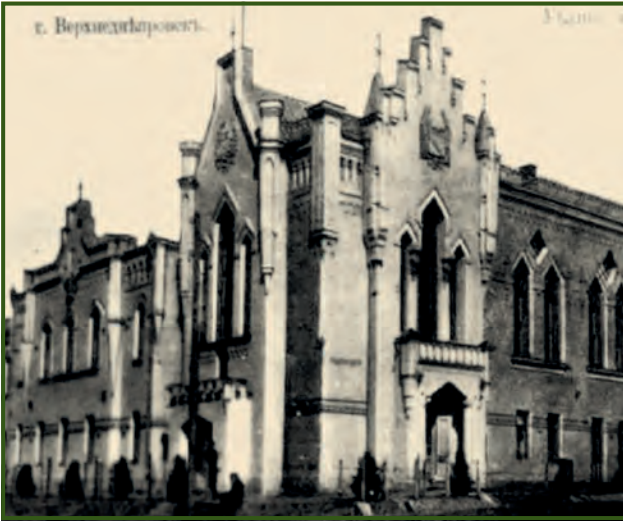
Город Верхнеднепровск. Здание уездного земского собрания. Почтовая открытка конца XIX века

Никополь и Херсон. Ежегодно проводилось пять ярмарок, на которых продавали скот, хлеб, коноплю, овощи и фрукты. На торги собиралось более тысячи человек. На саксаганские ярмарки и базары приезжали купцы из Петербурга, Москвы, Киева, Херсона, Елизаветграда, Екатеринослава.