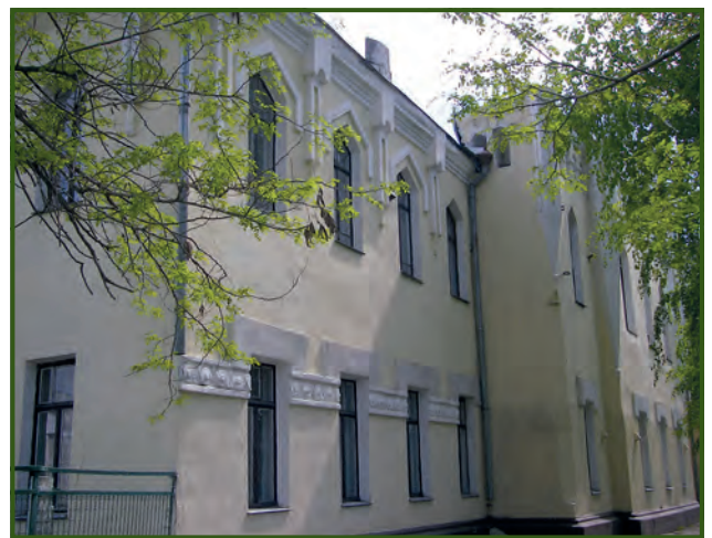
Здание бывшего Верхнеднепровского уездного земства. 2017 год

Председатель (Потоцкий): Это вопрос спорный, с одной стороны, больница действительно не богадельня, но с другой — по чувству человечества ( sic! ) нельзя оставлять умирать человека на улице» [3, с. 40-41].