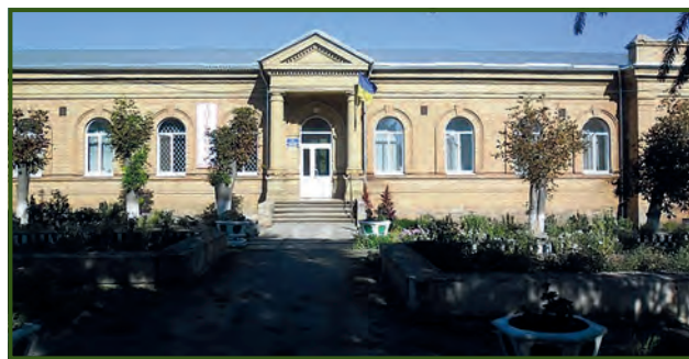
Современный вид главного корпуса Саксаганской земской больницы

Село Саксагань ныне относится к Пятихатскому району Днепропетровской области. 6 ноября 2016 года в Саксагани епископ Днепровский и Криворожский Симеон освятил храм Покровы Пресвятой Богородицы. Выстроенное земством здание Саксаганской больницы уцелело до наших дней. А еще на территории больницы сохранились деревья — немые свидетели минувших лет. Саксаганская амбулатория общей практики — семейной