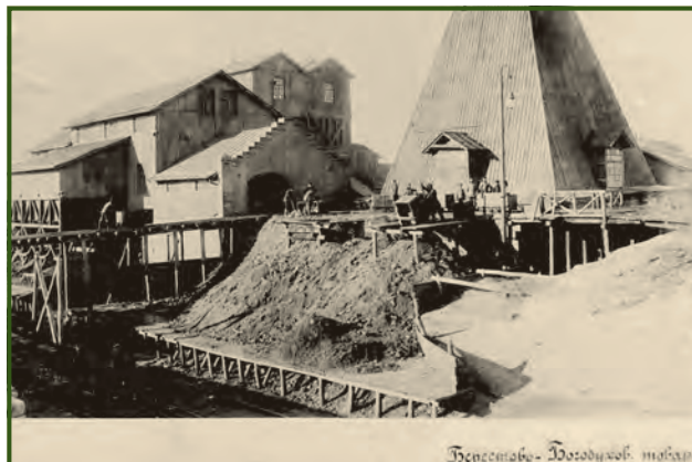
Берестово-Богодуховский рудник. Фото начала XX столетия