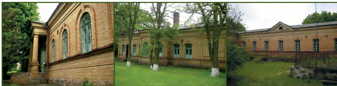
Корпуса бывшей Саксаганской земской больницы. 2009 год