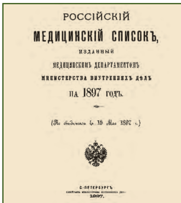
Российский медицинский список на 1897 год (титольная страница)