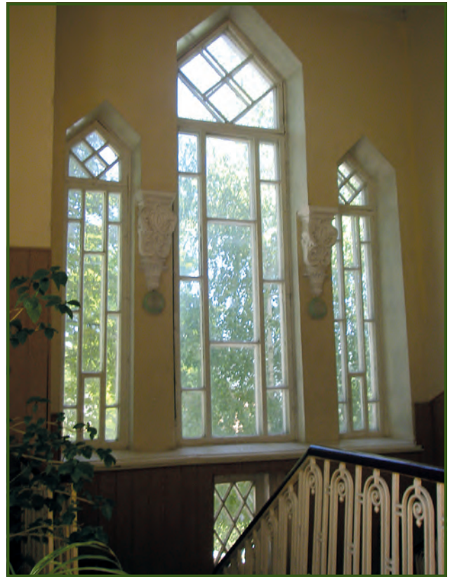
Интерьер здания бывшего Верхнеднепровского уездного земства. 2017 год