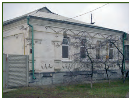
Місто Дніпро. Житловий масив Ігрень. Будинок по вулиці Дитинства, 34 (елементи декору нагадують елементи українських рушників). Фото 2017 року