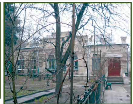
Місто Дніпро. Будинок просвітян Єфремових. Вулиця Дмитра Донцова, 13 (колишня Дмитра Донського). Фото 2015 року