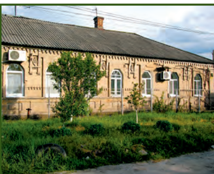
Місто Дніпро. Будинок по вулиці Просвітянській, 16. Район колишньої Мануйлівки. Фото 2018 року