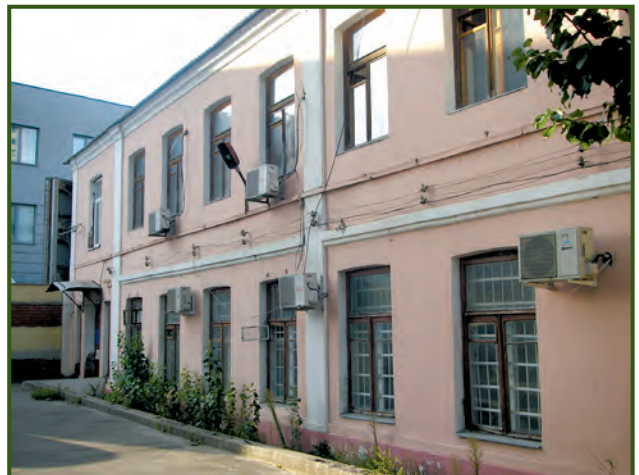
Місто Дніпро. Сучасне місце розташування «Просвіти». Вулиця Володимира Мономаха, 17а (колишня Московська). Фото 2018 року