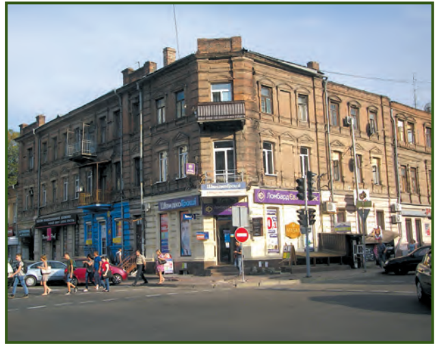
Місто Дніпро. Одна з адрес «Просвіти»: вулиця Ширшова, б. 10 (колишня Торгова). Будинок Давидовського. Фото 2018 року