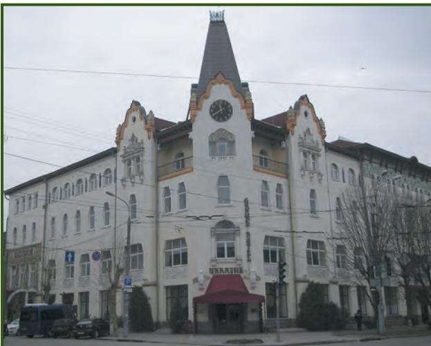
Місто Дніпро. Український будинок Хрінникова. Нині — готель Ukraine. Сучасне фото