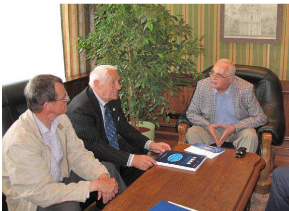
Рис. 3. Заснування міжнародного наукового журналу

Підписана Угода не виключає можливості реалізації інших заходів в галузі співробітництва Сторін, а також можливості доповнення окремих її розділів. Угода може бути автоматично пролонгована на наступні 5 років, якщо жодна зі сторін письмово не заявить про анулювання не пізніше, ніж за 3 місяці до кінця терміну її дії.