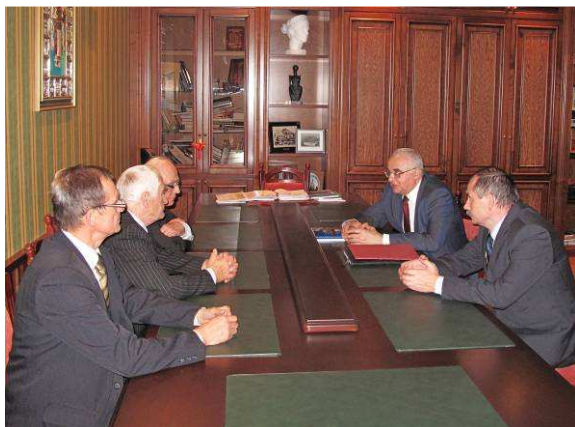
Рис. 1. Угода про співробітництво ПАН – КНУБА

В листопаді – грудні 2013 року відбулися чотиристоронні зустрічі між представниками Польської академії наук, Київського національного університету будівництва і архітектури, Національної академії аграрних наук України, Національної академії природокористування та курортного будівництва.