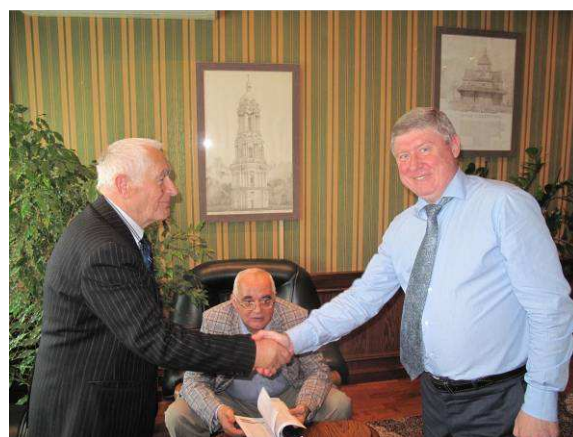
Рис. 4. Ухвалення спільних публікацій