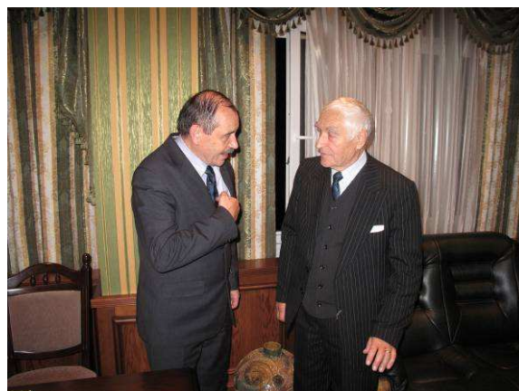
Рис. 2. Обговорення умов угоди

В результаті обговорення тематики та форм спільної роботи було прийнято рішення щодо укладання Угоди про міжна-