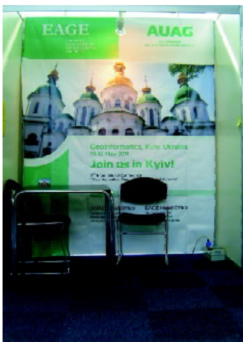
Стенд Всеукраїнської асоціації геоінформатики

9-та міжнародна конференція “Геоінформатика: теоретичні та прикладні аспекти”, яка була проведена у травні 2010 р. у м. Києві, продемонструвала зростання зацікавленості до цього наукового напрямку як вітчизняних, так і закордонних фахівців. Серед учасників конференції були присутні представники з понад 54 організацій, зокрема установ вітчизняної вузівської та академічної науки, Російської академії наук, вищих навчальних закладів і провідних профільних організацій Росії. В роботі конференції взяли участь представники Нідерландів, Польщі, Норвегії, Великобританії, Данії, Голландії, Єгипту. Організаторами конференції – Всеукраїнською асоціацією геоінформатики (ВАГ) та Європейською асоціацією геоучених та інженерів (EAGE) – було прийнято рішення про проведення чергової, 10-ї, конференції в 2011 р. (10–13 травня, м. Київ).