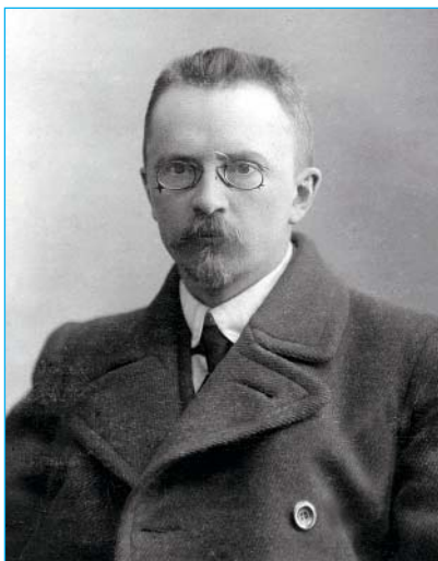
Едуард Карлович Фукс

25-річний Едуард Фукс приїхав до Кривого Рогу 1897 року. За плечима було Катеринославське реальне училище (1886–1889) та три курси Петербурзького гірничого інституту, який йому довелося залишити через сімейні обставини: після смерті батька Едуард, найстарший у багатодітній родині, взяв на себе турботу про молодших – п'ятьох братів і сестру. Спочатку він влаштувався у Бердянському повіті на рудник «Корсак Могила» (лиманіти). З перших днів роботи завзяття та обізнаність геолога привернули до нього увагу керівництва. Вже наступного, 1894, року Едуарду Фуксу, попри 22-річний вік і незакінчену вищу освіту, пропонують завідувати геологічними розвідками на залізну руду у Бердянському повіті, що проводилися Новоросійським товариством кам'яновугільного, залізорудного та рейкопрокатного виробництва (засноване Д. Юзом 1869 р.). У 1897-му керівництво товариства призначає Е.К. Фукса завідувати розвідками у Криворізькому повіті, і він переїздить до Кривого Рогу.