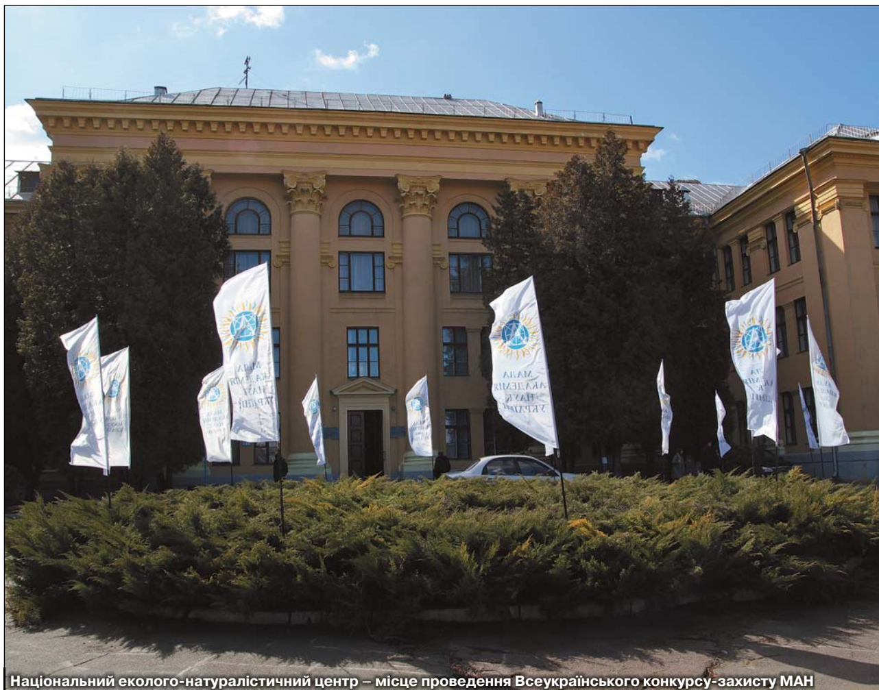
Національний еколого-натуралістичний центр – місце проведення Всеукраїнського конкурсу-захисту МАН

Фінальний етап Всеукраїнського конкурсу-захисту науково-дослідних робіт учнів – членів Малої академії наук України розпочався 23 березня відразу у двох відділеннях: філософії та суспільствознавства і наук про Землю.