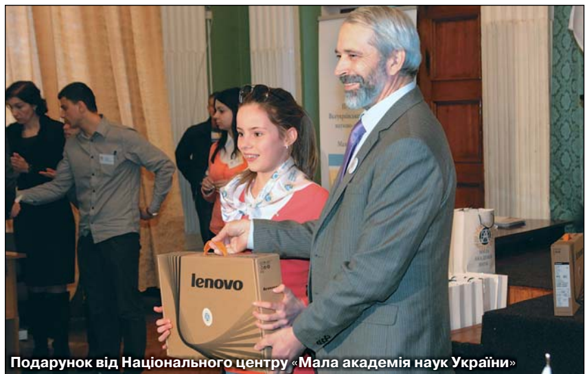
Подарунок від Національного центру «Мала академія наук України»