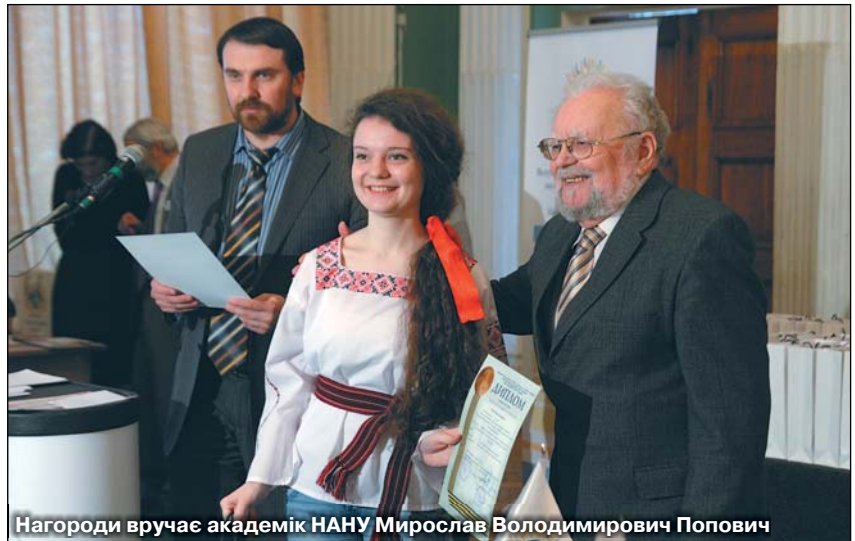
Нагороди вручає академік НАНУ Мирослав Володимирович Попович

«Ви, юні друзі, досліджуєте Землю і тих, хто живе на ній, їхній внутрішній світ, принципи й критерії, якими вони керуються в правовому, духовно-