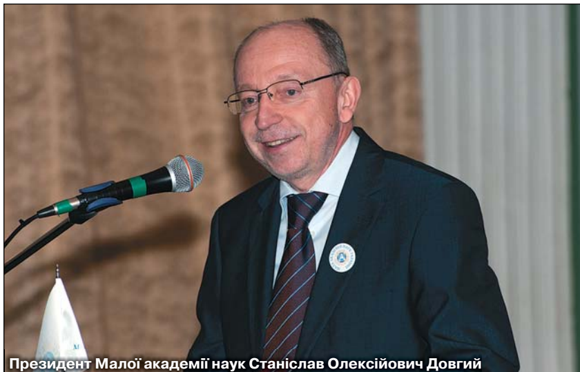
Президент Малої академії наук Станіслав Олексійович Довгий

Академік НАН України, керівник відділення морської геології та осадового рудоутворення Національного науково-природничого музею, геолог-практик із сотнями експедицій за плечима Євген Шнюков розповів молоді про актуальні завдання й виклики, що постають сьогодні перед геологічною наукою. «Нині ми стоїмо на порозі освоєння людством нового виду енергетичної сировини – газогідратів метану. Уявіть собі кригу, яка містить газ, – саме такий цікавий продукт є на дні Чорного моря. Як він розміщується, яким чином його видобувати, вчені вже досліджують. Але вивчити й використати його властивості – стане завданням вашого покоління. Вам доведеться багато попрацювати, добитися фінансування, адже голіруч нічого не зробиш, і працювати в Чорному морі. Я хочу