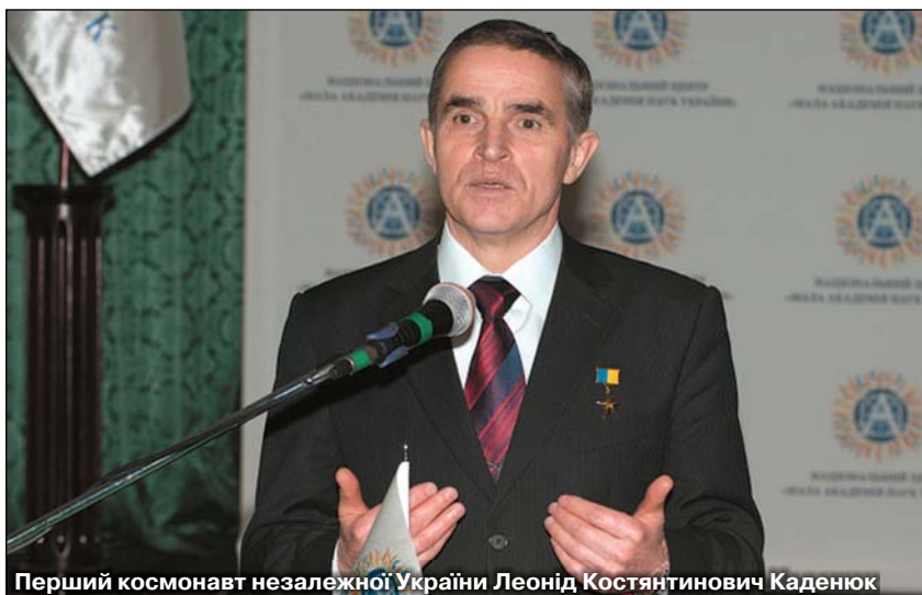
Перший космонавт незалежної України Леонід Костянтинович Каденюк