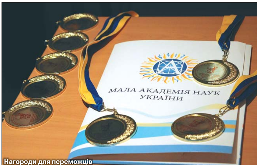
Нагороди для переможців