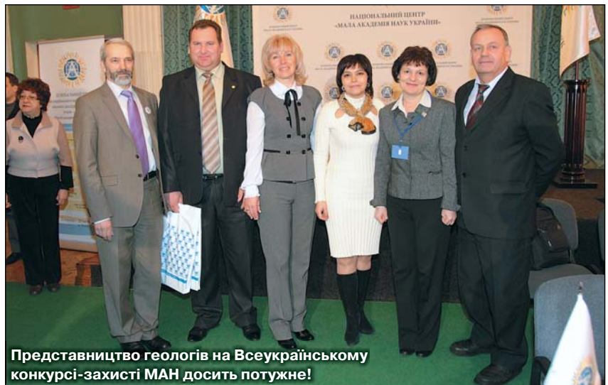
Представництво геологів на Всеукраїнському конкурсі-захисті МАН досить потужне!