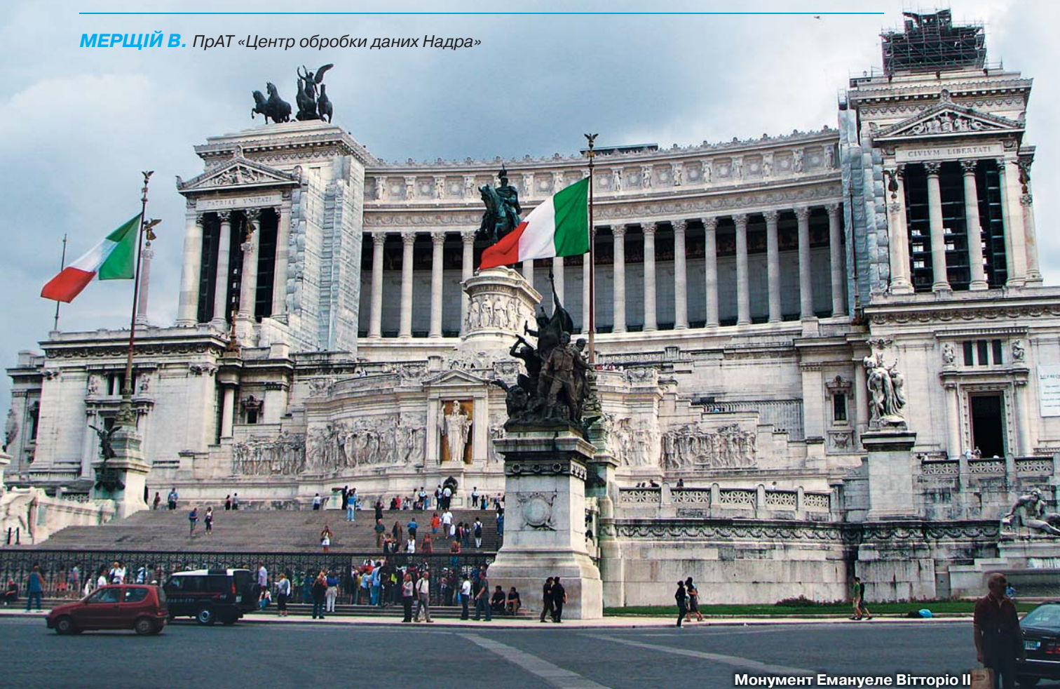
Монумент Емануеле Вітторіо II

МЕРЦІЙ В. ПрАТ «Центр обробки даних Надра»