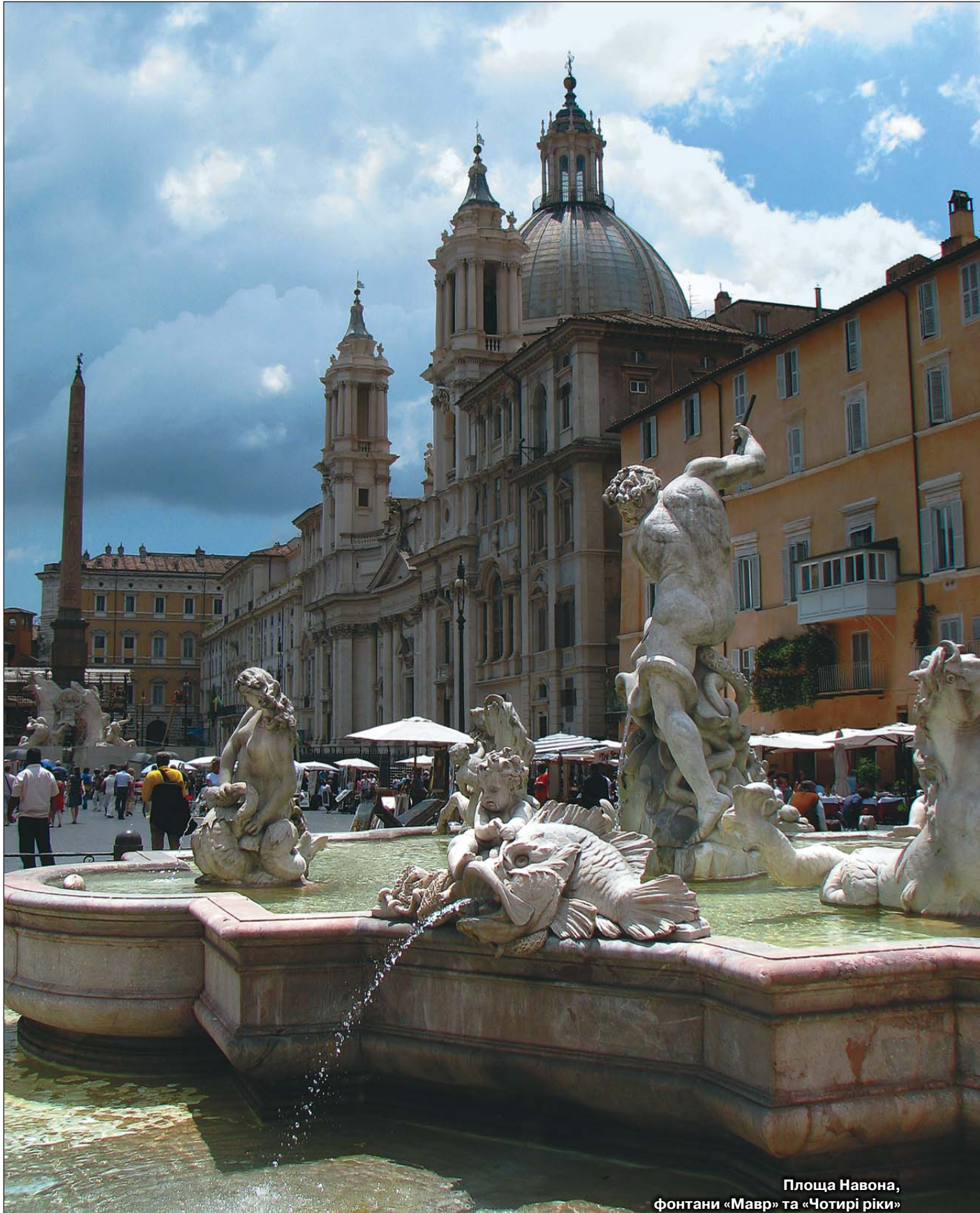
Площа Навона, фонтани «Мавр» та «Чотири ріки»