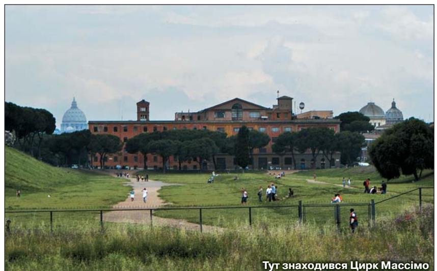
Тут знаходився Цирк Массімо