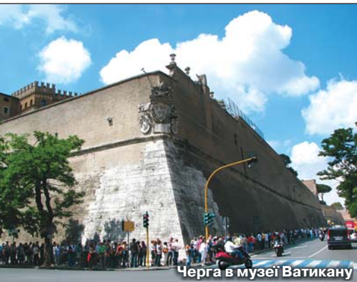
Черга в музеї Ватикану