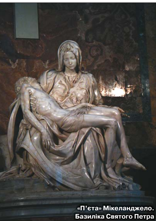
«П'єта» Мікеланджело. Базиліка Святого Петра

(Пінакотека) має величезну колекцію картин старих майстрів, з яких запам'яталися Рафаель Санті, Тиціан Вечелліо, Паоло Веронезе, Мікеланджело да Караваджо. В наступних залах можна побачити твори художників XIX–XX століть, зокрема Амедео Модільяні, Василя Кандинського та Сальвадора Далі.