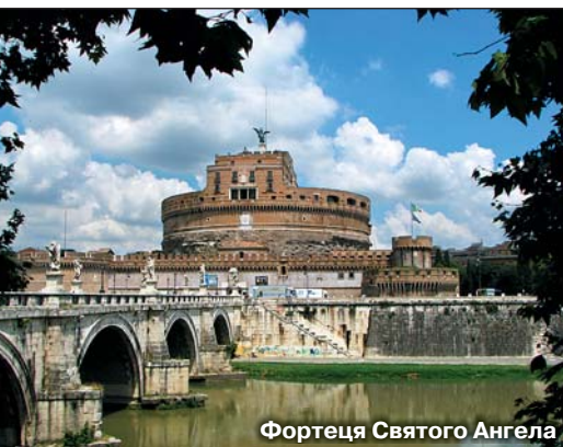
Фортеця Святого Ангела