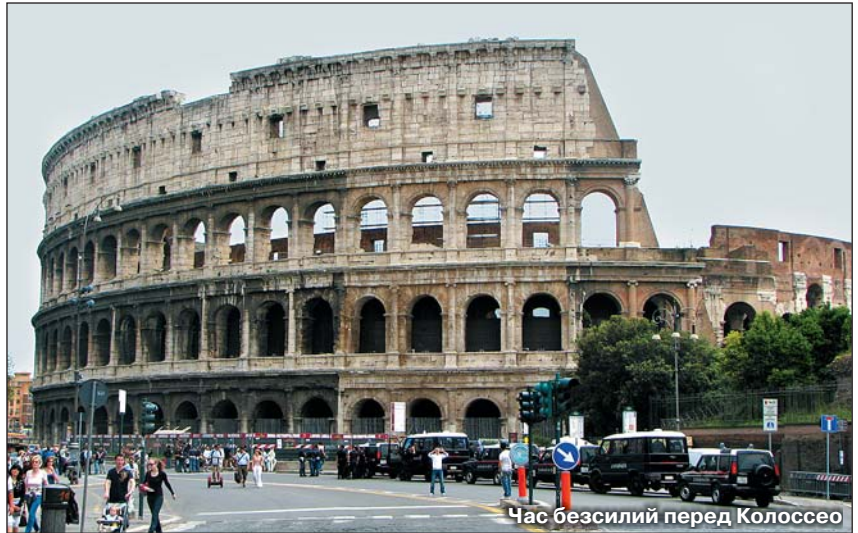
Час безилій перед Колоссео

Не менш відомі руїни – велетенські Терми Каракалли ( Terme di Caracalla ) розміром трохи більше 300х300 м, зведені протягом 206–217 рр., вважалися у свій час чи не восьмим чудом світу. Розпочав будівництво Септимій Север, а закінчував уже його син Каракалла. Однак ці лазні все ж трохи менші за Терми Діоклетіана. Під час трансферу з аеропорту Фьюмічіно і в зворотному напрямі водії всю дорогу мовчали, навіть проїжджаючи величну площу Республіки, Колоссео, Цирк Массімо, але біля лазень обидва чомусь промовили: Terme Caracalla! Римські терми будувалися на науковій основі. Тут було декілька відділень: аподитерій (роздягальня), судаторій (щось на кшталт сауни), кальдарій (гаряча вода), тепідарій (вода середньої температури, де належало охолонути), фригідарій (ба-