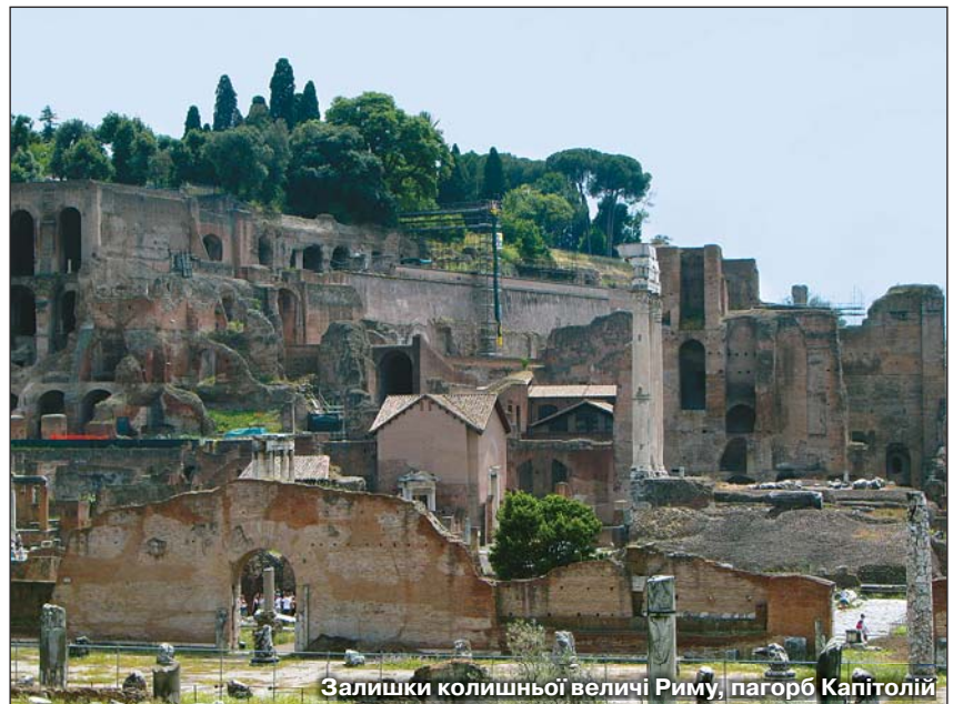
Залишки колишньої величі Риму, пагорб Капітолій