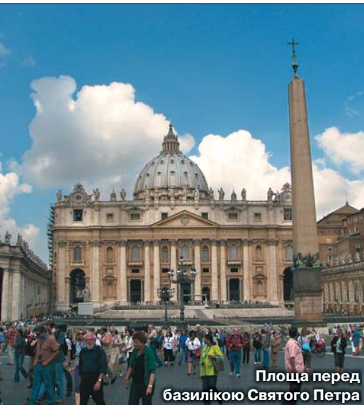
Площа перед базилікою Святого Петра