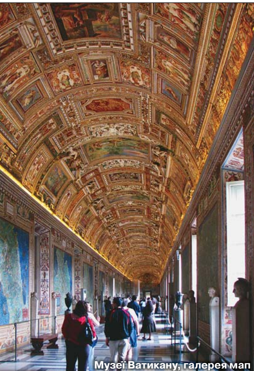
Музей Ватикану, галерея мап

Італійці, а надто римляни люблять свою історію, тому на вулицях Риму можна бачити силу-силенну пам'яників, скульптур та меморіальних дощок. На одній з них, що знаходиться на вулиці Сістіна, я побачив нашого славетного земляка – М.В.Гоголя. Тут, в будинку №126 на колишній Віа Феліче (Щаслива вулиця) він жив протягом 1838–1842 років і написав перший том «Мертвих душ». 2002 року в парку Боргезе відкрили пам'ятник письменнику.