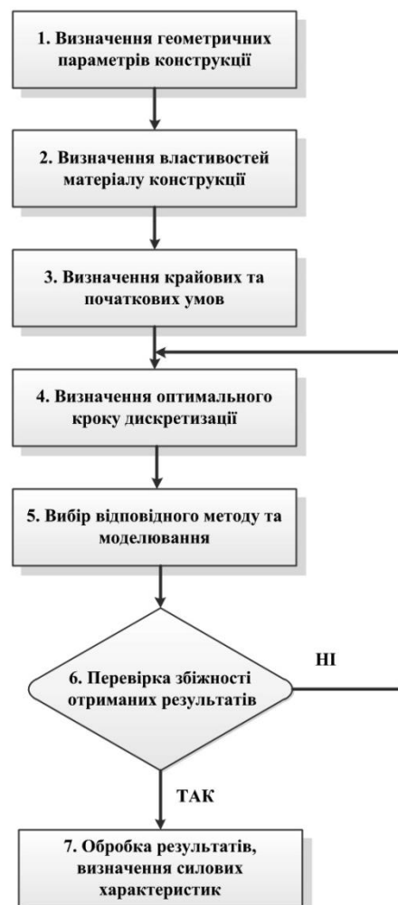
Рис. 1. Узагальнений алгоритм моделювання електромагнітних полів

Аналізуючи ці методи можна виділити певний алгоритм моделювання електромагнітних полів, представлений на рис. 1.