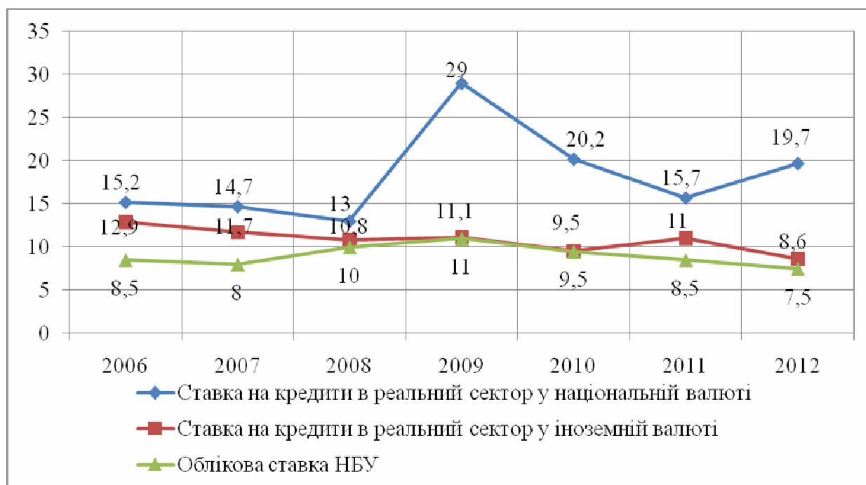
Рисунок 2. Величина облікової і кредитних ставок за 2006–2012 рр.,% [4]

Важливу роль у процесі стабілізації грошово-кредитного ринку відіграє активізація політики НБУ в посиленні банківського нагляду й контролю за діяльністю фінансово-кредитних установ. Цьому сприяє стабільне застосування інструментів грошово-кредитної політики. Відбулося поступове зниження й стабілізація облікової ставки НБУ, що сприяло становленню ставок кредитного, депозитного ринків та ставки міжбанківського кредитного ринку. В період з 2000 до 2012 року НБУ зменшив облікову ставку з 35 % до 7,5 %. Тенденцію її зміни за 2006 – 2012 рр. можна простежити на рис.2