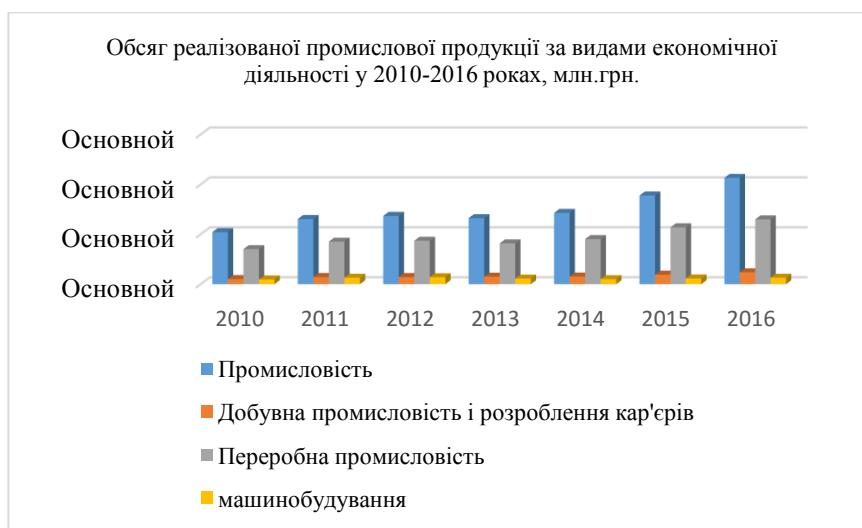
Рисунок 1. Обсяг реалізованої промислової продукції за видами економічної діяльності за 2010-2016 роки

Слід зазначити, що обсяги виробництва сектору машинобудування знаходяться на третьому місці після переробної та добувної галузей. (рис. 1)