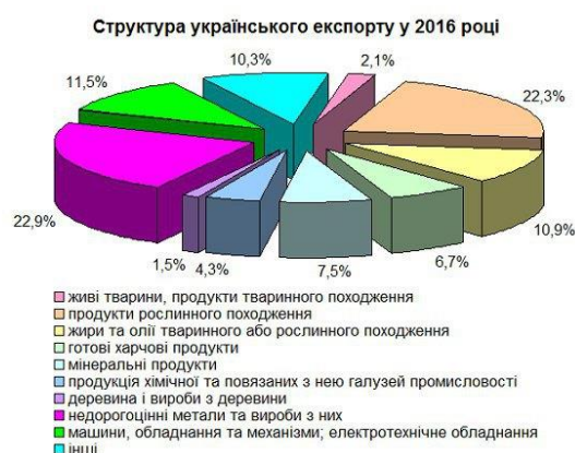
Рисунок 3. Структура українського експорту у 2016 р.*