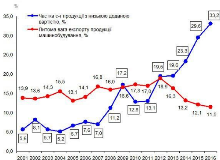
Рисунок 4. Динаміка експорту машинобудівної та сільськогосподарської продукції за 2001-2016 роки

Яскравим відображенням посилення сировинної орієнтації розвитку національної економіки та поглиблення процесів деіндустріалізації у сфері матеріального виробництва є динаміка питомої ваги експорту сільськогосподарської продукції з низькою доданою вартістю та експорту продукції машинобудування в загальній структурі українського експорту (рис. 4).