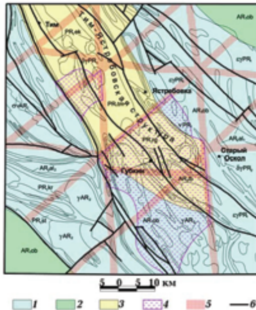
Рис. 2. Оскольский рудный район КМА. Схема геологической неоднородности земной коры. Плотностные блоки земной коры: 1 — пониженной плотности, 2 — нормальной плотности, 3 — высокоплотные, 4 — проекция на поверхность магнитоактивных образований на глубине, 5 — региональные трансформные зоны повышенной проницаемости земной коры, 6 — разрывные нарушения.