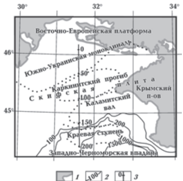
Рис. 1. Схема основных структур района исследований с положением профиля: 1 — суша; 2 — изобаты дна, м; 3 — модельный профиль.

Наблюденное гравитационное поле вдоль профиля подразделяется на два участка. Северная часть характеризуется постепенным понижением уровня \Delta g с 9,0 (ПК–10) до –8,5 мГал (ПК 60) с незначительными ундуляциями. Юж-