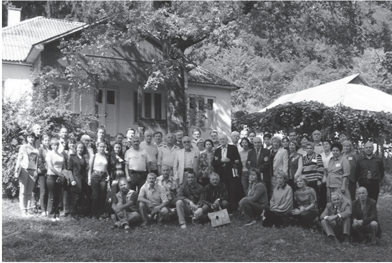
Учасники сьомих наукових читань імені академіка Євгена Лазаренка “Розвиток ідей Є. К. Лазаренка в сучасній мінералогії (до 100-річчя від дня народження)”