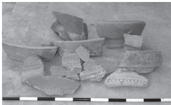
Рис. 2. «Дворцовая керамика» из Оглангала

Радиоуглеродный анализ угля пепельных отслоек колонн и фундамента III периода показывает, что строительство сооружения относится к IV–III векам до н.э.