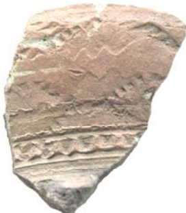
Уламок кераміки з побутового посуду з культурного шару періоду Київської Русі (центр с. Дениси).