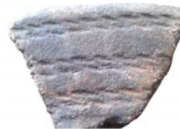
Фрагмент кераміки епохи міді-бронзи, знайдений на Царині (II тис. до н.е.).

визначили дату заснування с. Дениси – Городища щонайменше у IV–III ст. до н.е. і визначили цю дату (як і заснування на основі археологічних артефактів й інших населених пунктів України) на законодавчій основі.