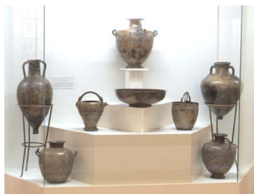
Грецький бронзовий посуд V–IV ст. до н.е., знайдений неподалік від с. Дениси в руслі р. Сунії. Зберігається у Національному музеї історії України (м. Київ).