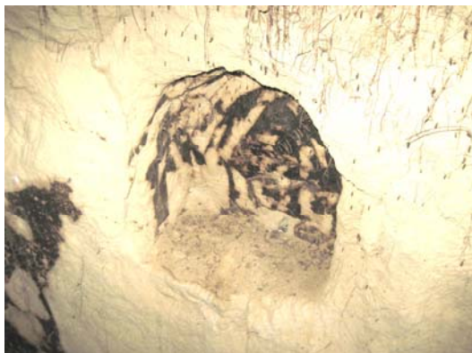
Фрагмент печери із Золотої гірки.

Одна із ніш, у якій знаходився горщик та інші керамічні вироби.