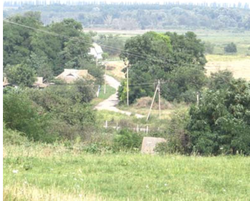
Вигляд на Царину і русло р. Супій із Золотої гірки.

Одна із ніш, у якій знаходився горщик та інші керамічні вироби.