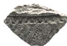
Фрагмент кераміки, знайдений на Царині (II тис. до н.е.).