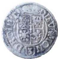
Західноєвропейська срібна копійка XVI ст. Знайдена в центрі с. Дениси.