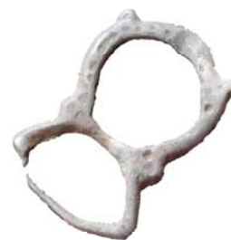
Металеві предмети з культурного шару періоду Київської Русі. Знайдені в центрі с. Дениси.