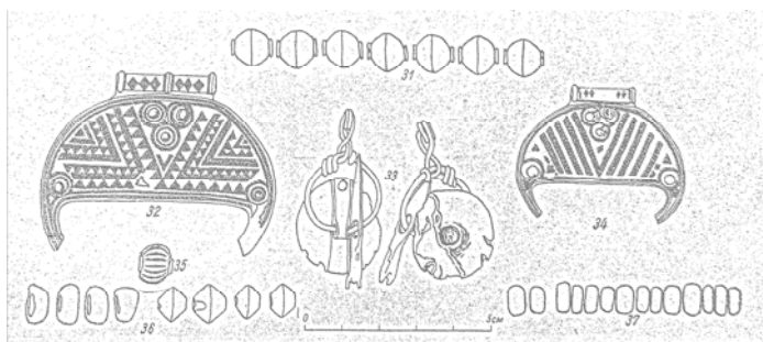
Ювелірні вироби зі скарбу с. Дениси, знайдені Т. Хворостовським, частина з яких виготовлена у Візантії та окремих західноєвропейських країнах. Датуються приблизно VI–VIII ст. н.е.