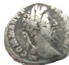
Римська копійка періоду правління імператора Коммода, знайдена на Царині (180–192 рр. н.е.).