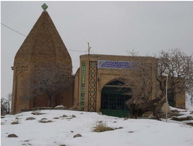
Figure 1. Imâmzâde 'Ali's mausoleum in Shekarnâb

But is the significance attached to the tombs of Shi'almâms and Imâmzâdes a reflection of their great political or religious status? Finding the answer to this question is not so easy, but in a society where there practically was no desire to preserve ancient monuments, a lot of effort was made to renovate and maintain religious constructions, and proficient builders and artists utilized the best of their skills to add to the grandeur of such places, in a way that even after centuries they still fill us with admiration.