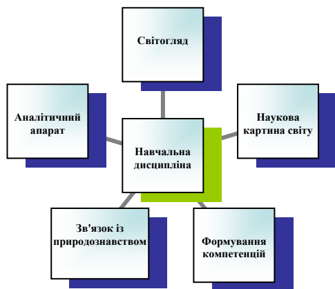
Рис. 4. Модель навчальної дисципліни

Проаналізуємо запропоновану модель. Як бачимо з Рис. 4 навчальна дисципліна має сприяти становленню особистості та її світогляду, формувати компетенцій, зокрема соціально особистісні. Має розширювати уявлення студентів про наукову картину світу. Оскільки мова йде про гуманітарну дисципліну (саме вони в більшій мірі забезпечать формування вищезгаданих компетенцій), тому вона має відображати її зв'язок з комплексом природничих, фізико-математичних дисциплін. Звісно, ця дисципліна має слугувати аналітичним апаратом для студентів, щоб набути ними знання розширювали межі їх свідомості. Така дисципліна повинна слугувати лакмусом, нагадуванням про те, що наука не вершиться сама по собі, експеримент не відбувається без дій людини, і саме вона має нести відповідальність за їх результат.