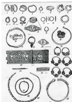
Прикраси [10, арк. 11]

Зимниське городище VI ст. було залишене близько середини VII ст. і не відновило свого існування. Згодом