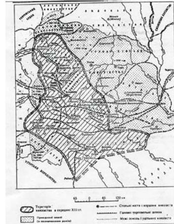
Волинсько–Галицьке князівство у другій половині XIII століття

Крім городів–міст та феодальних замків зустрічаються так звані городища–сховища (Піддубці, Підгайці, Гірка Полонка під Луцьком), які нібито не були постійно заселені і в яких укривалось лише населення довколишніх сіл під час набігів ворогів.