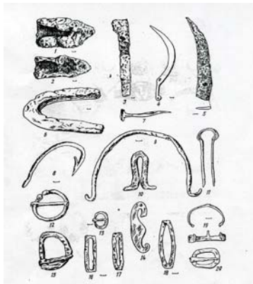
Ріллянічі знаряддя і предмети господарського та побутового призначення [8, арк. 240]