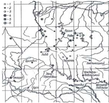
Слов'янські пам'ятки VI – IX ст.:

землях, в тому числі і волинській. На Волинській землі значне скупчення городищ виявлено на землях між Західним Бугом і Случчю, на вододілі між ріками Лугом і Липою (лівими притоками Стиру), в районі Полісся. За археологічними даними давньоруський город Луцьк, про який літописи повідомляють вперше наприкінці XI ст., існував як слов'яноруське поселення вже з VII–VIII ст.