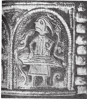
Зображення гусяра на двостулковому браслеті–наручі. XII ст. Срібло, карбування, гравірування, чорнь.

називають «срібним фольклором», що доповнює скупі уривки давнього епосу.