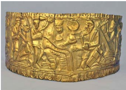
Золота пластинка. Друга половина IV ст. до н.е. З кургану поблизу с. Сахнівка, Черкаська обл.

Зображення музиканта знаходимо на скіфській золотій пластині – прикрасі головного убору, знайденої при розкопках кургану поблизу села Сахнівка Черкаської області (1901 р.). Ця коштовна знахідка датується другою половиною IV ст. до н.е. і зберігається в Музеї історичних коштовностей України. Майже в центрі розгорнутої композиції з культовим сюжетом серед інших персонажів можна побачити бородатого музиканта, який грає на струнному, подібному до грецького інструменті, супроводжуючи магічний ритуал.