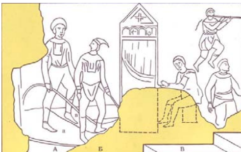
Південна вежа, Фресковий розпис що розташований вздовж сходів, що ведуть на хори. Реконструкція С. Висоцького та І. Тоцької.

Нема сумнівів, що кількість, розмаїття та довершеність зображених на фресці музичних інструментів (духові, ударні, струнні та орган з ножними міхами, який завдяки впливу Візантійської культури на життя княжого двора використовувався лише для світського музикування) передбачала надзвичайну злагоженість звучання, а відтак – професіоналізм виконавців. Отже, при абстрагуванні від сюжету можна вважати, що зазначений фресковий розпис повною мірою відбиває, по–перше, справжній стан професійної інструментальної музики і досягнення музичної культури Київської Русі, по–друге, зміст і виконання фрескових розписів вказує на оригінальність давньоруського живопису та високий рівень майстерності художників.