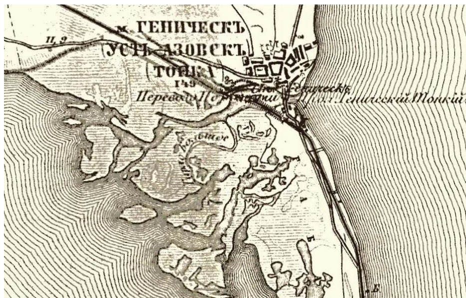
Рис. 2. Зображення протоки Тонкої на карті 1876 року (після створення залізниці на Арабатську стрілку)

Аналізуючи більш пізні карти останньої чверті XIX ст. (рис. 2), карти Херсонської області до 70-х років XX століття і, зокрема, північної частини Арабатської стрілки, також бачимо чітке зображення єдиної протоки, яка сполучає затоку Сиваш з Азовським морем.