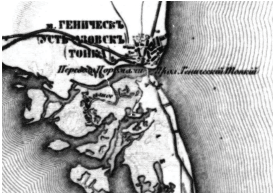
Рис. 1. Зображення протоки Тонкої на карті середини XIX ст. (до створення залізниці на Арабатську стрілку)

Аналізуючи більш пізні карти останньої чверті XIX ст. (рис. 2), карти Херсонської області до 70-х років XX століття і, зокрема, північної частини Арабатської стрілки, також бачимо чітке зображення єдиної протоки, яка сполучає затоку Сиваш з Азовським морем.