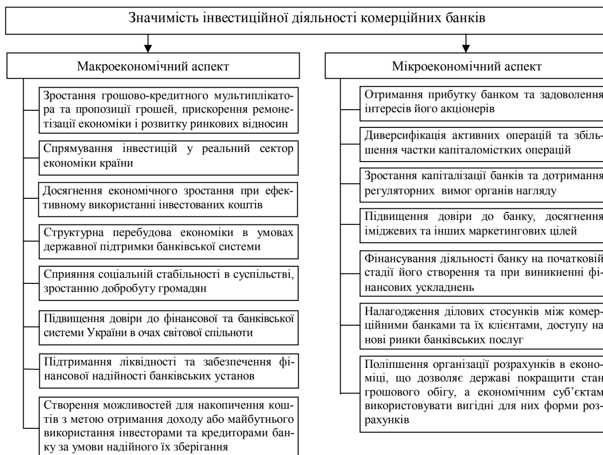
Рис. 1. Значимість інвестиційної діяльності комерційних банків [4, 5]

Інвестиційна діяльність комерційного банку має ґрунтуватися на наступних засадах: - відповідність стратегічним цілям діяльності банку, орієнтація на потреби ринку; - створення продуктів та послуг, що можуть полегшити доступ банку до дешевих та стійких джерел ресурсів на ринку; - відповідність за термінами джерел формування ресурсів та напрямків їх використання; - диверсифікованість джерел банківських ресурсів, що підвищить сталість ресурсної бази банку в цілому; - врахування зовнішніх та внутрішніх чинників середовища банку, мінімізація впливу банківських ризиків; - організація активної роботи філійної мережі банку щодо залучення ресурсів; - використання сучасної технічної бази, комп'ютерної техніки і технологій для економічного обґрунтування рішень.