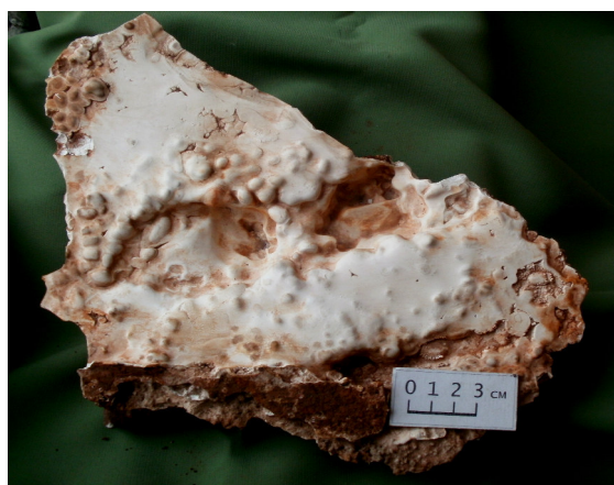
Fig. 5. Calcite spaddle from a puddle at worked out underground working floor of V.I.Lenin Mine.