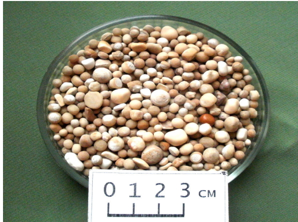
Fig. 6. “Mine pearls” from one of worked out underground working of V.I.Lenin Mine.

Mineral formations from underground mining working embellish Kryvyi Rih National University Mineralogical Museum exhibition, other Ukrainian museums exhibitions, may represent schools or individual collections exhibits.