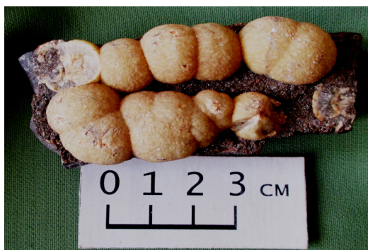
Fig. 3. Spherulitic aggregates of calcite from a void in martitized cummingtonite-magnetite quartzites from an underground working of G.K.Ordzhonikidze Mine.

Newly formed aggregates of calcite and rarer aragonite are notable for big size and shape variety. Their veinlets and holes, cracks, other cavities filling in enclosing hematite quartzites and schists by spherulitic (fig. 3), radially fibrous, granular, earthy aggregates are the most abundant. Formations of calcite stalactites and stalagmites having length of up to 100 cm (fig. 4) are quite common.