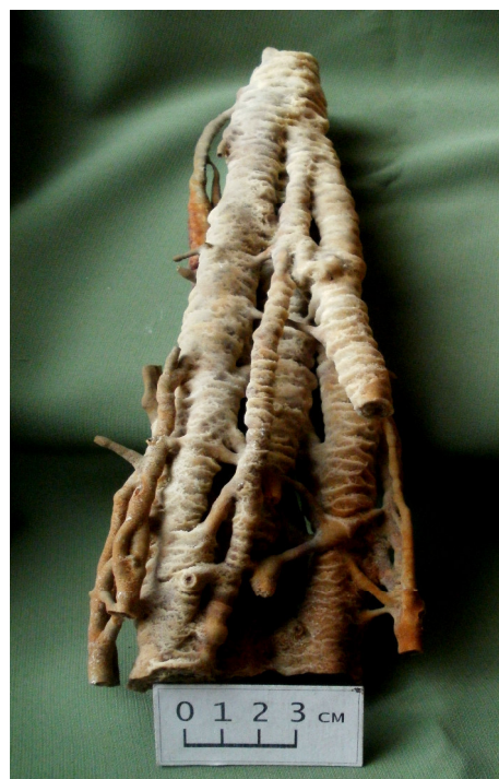
Fig. 4. Intergrowth of several calcite stalactites from the roof of a worked out underground working of “Zorya-Octiabrskaya” Mine.

copiapite, alumstone, huntite and other minerals – in all more than 40 minerals and mineral varieties in underground mining working.