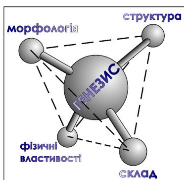
Рис. 1. Зв'язок генезису та властивостей мінералу – тетраедр типоморфних ознак і відповідних напрямків мінералогічних досліджень.

типоморфний тетраедр (рис. 1), де ознаки мінералу знаходяться в кутах, а центр належить генезису.