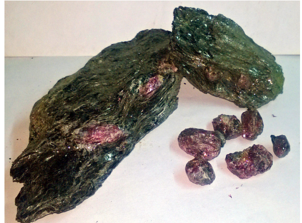
Рис. 2. Лінзовидні кристали гранату в кварц-біотитовому сланці родіонівської світи. Розмір зразка за максимальним виміром 10 см.

Кристали гранату, представленого альмандином, характеризуються розміром від 0,1 до 3 см, іноді до 6 см, утворюють порфіробласти, лінзовидні агрегати (рис. 2). Гранат Петрівського й Артемівського родовищ користується попитом як колекційний матеріал та сировина для ювелірних виробів.