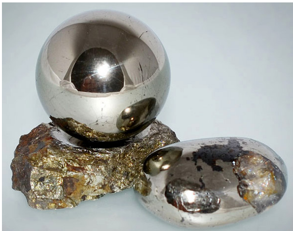
Рис. 4. Сувенірні вироби з масивного («зливного») піротину. Діаметр кулі 7 см.

Піротин досить поширений у залізистих породах родовищ Кривбасу, в тому числі Петрівського й Артемівського [1, 2]. В магнетитових, силікат-магнетитових кварцитах артемівської світи північної та центральної ділянок Петрівського родовища він, зазвичай, утворює різні за розміром вкраплення та прожилки. Розмір скупчень та потужність прожилків досягає 30 см. Зазвичай, кристали, щітки піротину є об'єктом колекціонування, але протягом останніх років його використовують також для виготовлення художніх виробів (рис. 4).