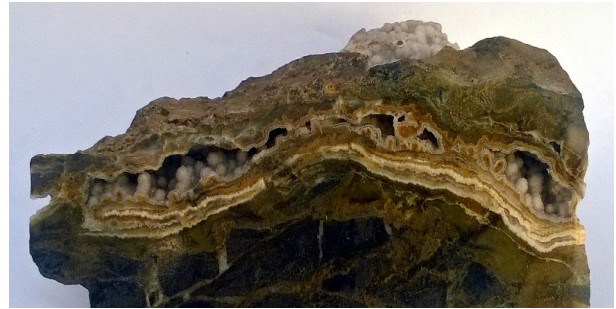
Рис. 5. Натічні агрегати халцедону в порожнині з магнетит-силікатного кварциту артемівської світи.

та ін. Сьогодні халцедон – один з найбільш популярних виробних каменів Петрівського й Артемівського родовищ. Він добре піддається обробці. Найбільш поширений різновид виробів з нього – кабошон. Різноманітність забарвлення, досконалість поліровки, цінова доступність робить його вживаним матеріалом для створення статуєток, ваз, мозаїк, деталей інтер'єру.