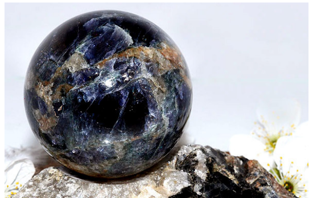
Рис. 3. Сувенірна куля, виготовлена з кордієриту Петрівського родовища.

Кордієрит – досить рідкісний для Криворізького басейну мінерал, зустрічається в складі високоглиноземних порід зеленоріченської світи (рис. 3).