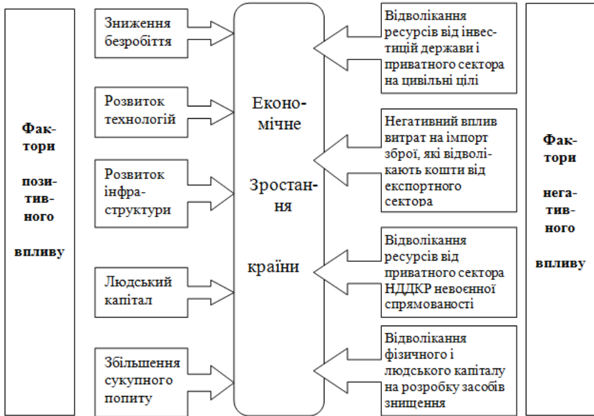
Рис. 2. Фактори впливу воєнних витрат на економічне зростання країни

Таким чином, існують як несприятливі, так і сприятливі фактори впливу воєнних витрат на економічне зростання. На рисунку 2 наведений перелік несприятливих і сприятливих факторів впливу воєнних витрат на економічне зростання.