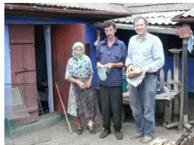
Збір зразків зернобобових і овочевих культур у селянському господарстві (Фрунзівський район Одеської обл.)