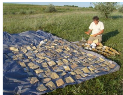
Сушка зібраних зразків