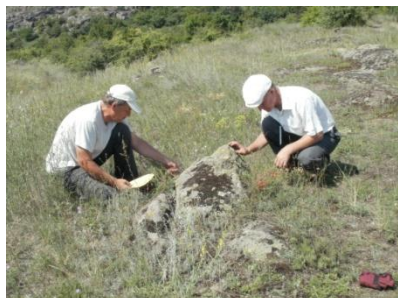
Ландшафтний заказник «Шумок» (Бобринецький р-н Кіровоградської обл.)