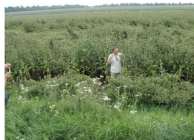
Поле розгоропші плямистої (Миколаївська обл.)