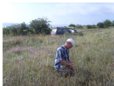
Степовий ценоз на березі Дністровського лиману (Овідіопольський район Одеської обл.)