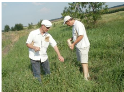
Степова ділянка на лівому березі р. Інгул (Устинівський р-н Кіровоградської обл.)