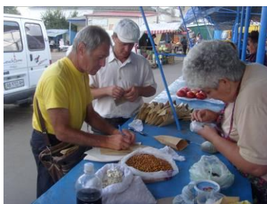
Відбір зразків зернобобових і овочевих культур. (м. Котовськ Одеської обл.)