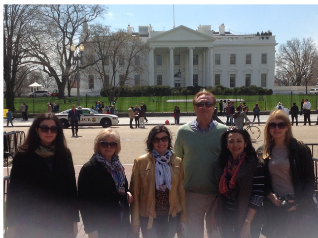
Біля резиденції Президента США, м. Вашингтон, США