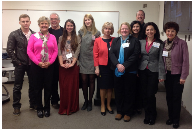
Учасники українсько-американської секції конференції