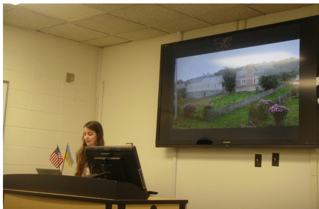
Виступи науковців зі Сполучених Штатів Америки