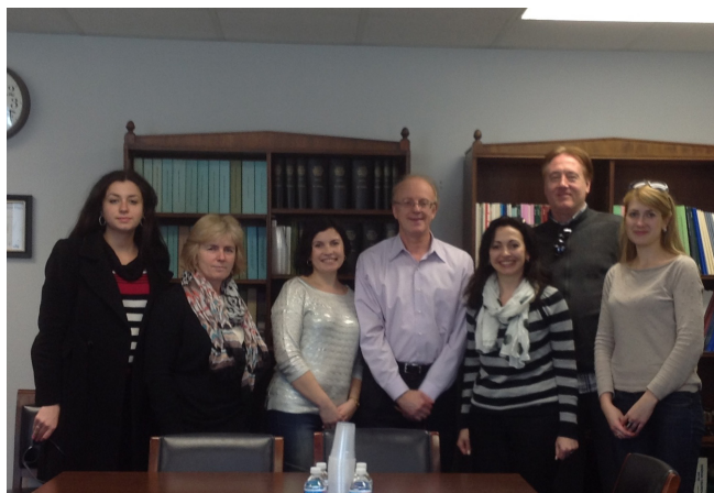
Зустріч викладачів Прикарпатського національного університету з американським сенатором Орестом Дейчаківським і доктором соціології, проф. Дональдом Е. Девісом, м. Вашингтон, США