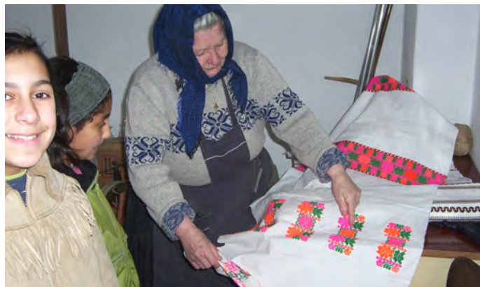
Obr. 13 Exkurzia ku tkáčke

Výhodou spomínaných aktivít je, že náklady na materiálne zabezpečenie sú minimálne, možno využiť napríklad odpadový materiál z domácnosti, nepoužiteľné textilie, priadze, kartóny zo škatúl a pod. Na záver každej aktivity je vhodné, ak žiaci zhodnotia svoju prácu a prezentujú ju, napríklad sa môžu zahrať na redaktorov televíznych novín a vytvoriť reportáž o remeselných tradíciách svojich predkov. Pri využívaní ergoterapie s prvkami tradičných ľudových remesiel u rómskych žiakov a žiakov zo sociálne znevýhodňujúceho prostredia je dôležité, aby akákoľvek pracovná činnosť bola založená na báze dobrovoľnosti a možnosti výberu. Musí ich oslovovať samotná činnosť, musí byť pre nich radosťou jej samotné vykonávanie.