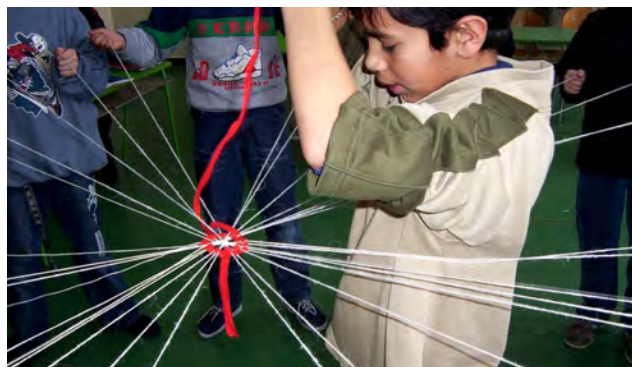
Obr. 11 Vytváranie „slniečkovej čipky“

Slniečková čipka (obr. 11,12): Napriek tomu, že sa slniečková čipka na Horehroní nevyužívala ani v odeve, ani v bytovom textile, pri oboznamovaní sa žiakov s tradíciami spracúvania textílií je možné využiť techniku pravidelného prevázovania - preplietania priadzí. Slniečková čipka sa vytvárala na princípe pravidelného preplietania lúčovite usporiadaných osnovných a útkových priadzí. Postup je možné vysvetliť žiakom prostredníctvom aktivity: žiaci stoja v kruhu a každý z nich drží v pravej aj v ľavej ruke špagát, ktorý je jedným koncom zviazaný v strede kruhu s ostatnými špagátmi. Žiak špirálovite preplieťa útok z nastrihanej cca 2 cm širokej úpletovej textílie