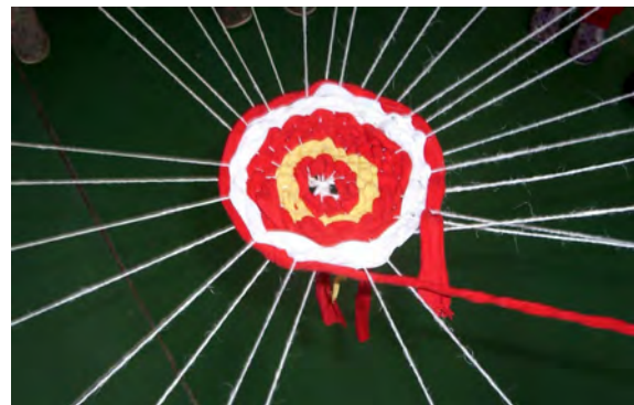
Obr. 12 „Slniečková čipka“