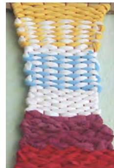
Obr. 6 Žiacka práca

Pletenie v rukách (obr. 7): Potrebujeme 7 približne 60 cm dlhých priadzí (vlnené, bavlnené, mulinka, perlovka a pod.). Môžu byť všetky jednej farby, príp. vždy dve rovnakej alebo každá inej farby. Všetky priadze obidvoma koncami zviažeme na uzol a upevníme (pomocou spínacieho špendlíka alebo inej priadze napr. o nohu lavice). Každú priadzu navlečieme na 1 prst: ukazovák, prostredník, prsteník – na oboch rukách; malíček – na jednej ruke. Šnúročky možno pliesť tromi spôsobmi. 1) Malíčkom pravej ruky, ktorý nepridržiava priadzu, snímeme priadzu z ukazováka ľavej ruky. Priadze na ľavej ruke následne upravíme tak, že ukazovákom 2) Malíčkom ľavej ruky, ktorý je voľný, prevlečieme cez medzery vytvárané priadzami pravej ruky malíčka, prsteníka a ukazováka a zároveň z pravej ukazováka ľavým malíčkom snímeme priadzu. Priadze na pravej ruke upravíme tak, že ukazovákom snímeme priadzu z prostredníka, prostredníkom z prsteníka a prsteníkom z malíčka. Pravým malíčkom, ktorý ostane voľný, prevlečieme cez medzery vytvárané priadzami ľavého malíčka, prsteníka, prostredníka a ukazováka a zároveň z ľavého ukazováka pravým malíčkom snímeme priadzu. Priadze na ľavej ruke upravíme rovnakým