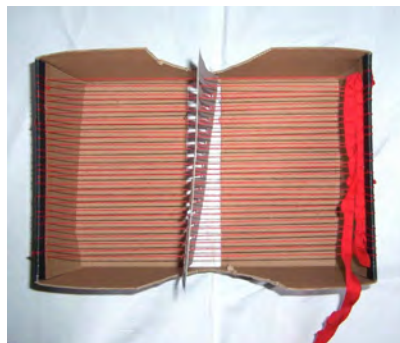
Obr. 5 Tkanie žiakov pomocou debničky