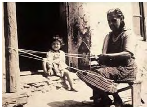
Obr. 1 Tkanie pomocou doštičky

Tkanie pomocou doštičky (obr. 1,2,3): Niekoľko metrov dlhú osnovu tvoria priadze vedené otvormi v priečkach doštičky a medzerami medzi nimi. Pohybom doštičky nadol a nahor sa medzi priadzami vedenými otvormi priečok a medzerami vytvára medzera (ziva), do ktorej sa pomocou zrolovaného výkresu s navinutou priadzou (nastrihanými prúžkami 2 cm širokej úpletovej textílie) vtkáva útok. Napnutie osnovy sa dosahuje fixovaním oboch koncov osnovy dvoma žiakmi. Dôležité je zdôrazniť žiakom ubíjanie útkovej priadze. Žiaci ľubovoľne striedajú rôznofarebnú útkovú priadzu.