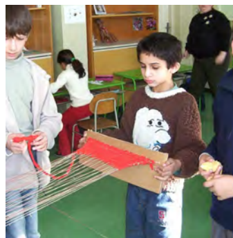
Obr. 2 Tkanie žiakov pomocou doštičky