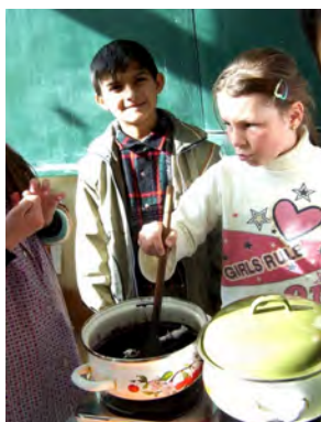
Obr. 9 Batikovanie

Batikovanie (obr. 9,10) je spôsob zdobenja textílií pri farbení; možno ho považovať za predchodcu modrotlača. Tzv. vosková batika sa robí za pomoci vosku, ktorým sa na textíliu nakreslí vzor. Textília sa následne zafarbí, pričom si plochy, na ktorých bol nakreslený vzor zachovávajú pôvodnú farbu. Vyvážovaná batika je spôsob vzorovania vyvážovaním. Pred farbením sa na textílii vytvorí zvázovaním, zošivaním, všívaním rôznych drobných predmetov, šitím stehov základ budúceho vzoru. Pripravená textília sa zafarbí a vzor má podobné neohraničené kontúry ako vzory vytvárané voskom.