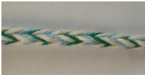
Obr. 7 Šnúročka – žiacka práca

Pletenie na forme (obr. 8): Forma má tvar dreveného klátika tvaru zrezaného kužeľa, s dvomi radmi klinčekov – jeden rad po obvodu plášt'a kužeľa pri širšej podstave, druhý po obvodu plášt'a pri užšej podstave. Osnova budúcej pleteniny sa vytvára napnutím priadze striedavým obtáčaním klinčekov spodného a vrchného radu. Osnova sa preplieťa postupným obtáčaním dvoma pramienkami priadze okolo osnovej priadze v jednom rade. Podľa hrúbky priadze sa osnova preplieťa 4-6 priadzami, rozdelenými na 2 pramene. Podľa spôsobu a smeru obtáčania a zvolenej farebnosti pramienkov možno vytvárať zaujímavé vzory (Čellárová, 1997). Žiaci môžu namiesto formy použiť kotúč z toaletného papiera, na ktorom pomocou ihly a bavlnky vytvoria osnovu. Po obvodu vrchnej aj spodnej časti kotúča nalepia 2 prúžky papiera, na ktorých sú vyznačené miesta vpichu ihly (vzdialených 1 cm). Osnovu následne preplietajú postupným obtáčaním farebnými vlnenými priadzami pomocou hrubej ihly.