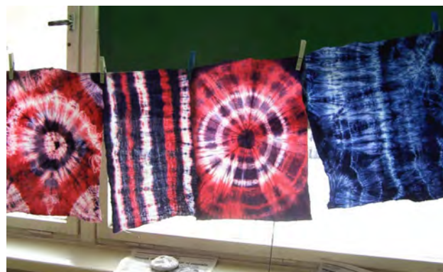
Obr. 10 Žiacke práce

Slniečková čipka (obr. 11,12): Napriek tomu, že sa slniečková čipka na Horehroní nevyužívala ani v odeve, ani v bytovom textile, pri oboznamovaní sa žiakov s tradíciami spracúvania textílií je možné využiť techniku pravidelného prevázovania - preplietania priadzí. Slniečková čipka sa vytvárala na princípe pravidelného preplietania lúčovite usporiadaných osnovných a útkových priadzí. Postup je možné vysvetliť žiakom prostredníctvom aktivity: žiaci stoja v kruhu a každý z nich drží v pravej aj v ľavej ruke špagát, ktorý je jedným koncom zviazaný v strede kruhu s ostatnými špagátmi. Žiak špirálovite preplieťa útok z nastrihanej cca 2 cm širokej úpletovej textílie