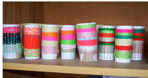
Obr. 8 Zápästky – žiacke práce

Batikovanie (obr. 9,10) je spôsob zdobenja textílií pri farbení; možno ho považovať za predchodcu modrotlača. Tzv. vosková batika sa robí za pomoci vosku, ktorým sa na textíliu nakreslí vzor. Textília sa následne zafarbí, pričom si plochy, na ktorých bol nakreslený vzor zachovávajú pôvodnú farbu. Vyvážovaná batika je spôsob vzorovania vyvážovaním. Pred farbením sa na textílii vytvorí zvázovaním, zošivaním, všívaním rôznych drobných predmetov, šitím stehov základ budúceho vzoru. Pripravená textília sa zafarbí a vzor má podobné neohraničené kontúry ako vzory vytvárané voskom.