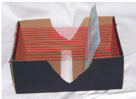
Obr. 4 Tkanie pomocou debničky

Tkanie pomocou debničky (obr. 4,5,6): Debničku možno vyrobiť zo škatule od topánok tak, že pomocou ihly vytvoríme osnovu z bavlnených priadzí vzdialených cca 1 cm, ktoré zároveň prevliekame medzerami tkacej doštičky. Postup je podobný ako pri tkaní pomocou tkacej doštičky.