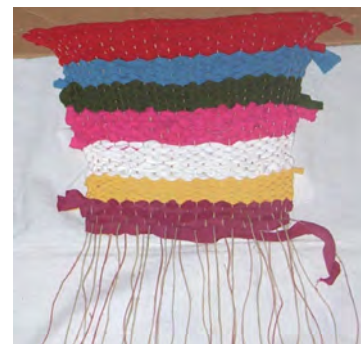
Obr. 3 Žiacka práca

Tkanie pomocou debničky (obr. 4,5,6): Debničku možno vyrobiť zo škatule od topánok tak, že pomocou ihly vytvoríme osnovu z bavlnených priadzí vzdialených cca 1 cm, ktoré zároveň prevliekame medzerami tkacej doštičky. Postup je podobný ako pri tkaní pomocou tkacej doštičky.